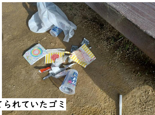
市内の公園で捨てられていたゴミ