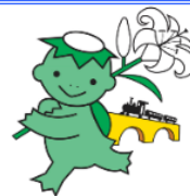
遠野市公式キャラクター 「カリンちゃん」