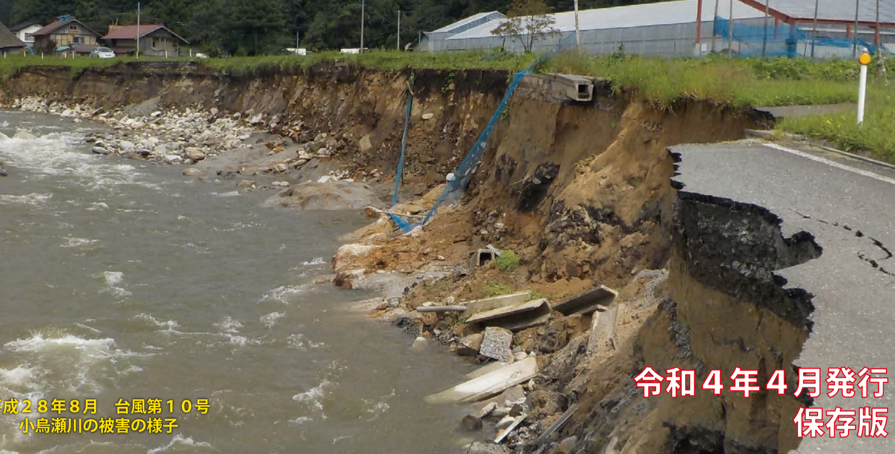
令和4年4月発行 保存版

土砂災害や水害から自らの命、家族の命を守るために！ 大雨による土砂災害や水害から命を守るためには、目頃からの備えや大雨の際の気象情報や遠野市からの避難情報を入力し、避難行動に結び付けることが重要です。このマップはお住まいの地域の土砂災害や水害の危険性のある区域を示していますので、事前に把握し、災害への備えにお役立てください。