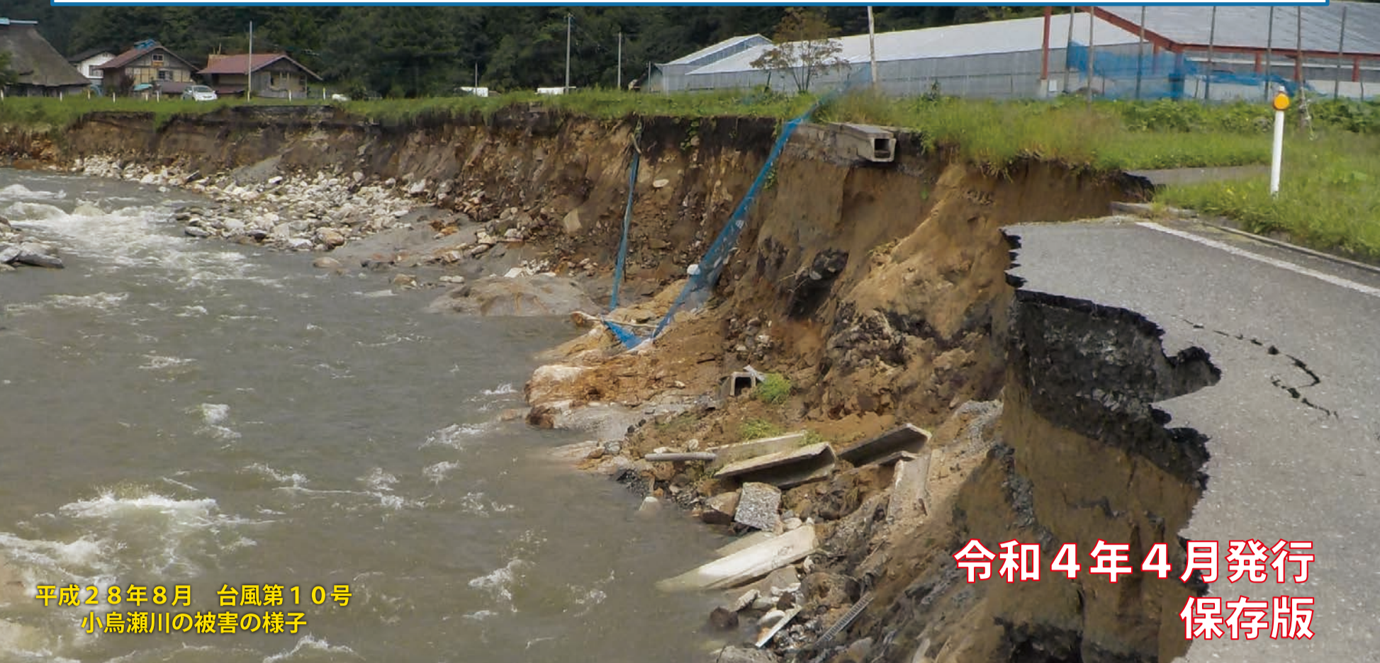
平成28年8月 台風第10号 小島瀬川の被害の様子 令和4年4月発行 保存版

大雨による土砂災害や水害から命を守るためには、目頃からの備えや大雨の際の気象情報や遠野市からの避難情報を入力し、避難行動に結び付けることが重要です。このマップはお住まいの地域の土砂災害や水害の危険性のある区域を示していますので、事前に把握し、災害への備えにお役立てください。