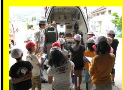
宮守小学校 社会科見学 6月15日に宮守小学校の4年生14名が社会科見学のため来所されました。消防車や救急車の中を熱心に見たり、消防のしくみを学んでいました。

7月15日にみやもり荘(写真左)と7月19日に高館の園(写真右)で避難訓練が行われ、7月25日にはみやもり荘で夜間の避難訓練が行われました。みなさん真剣な様子で訓練に臨んでいました。