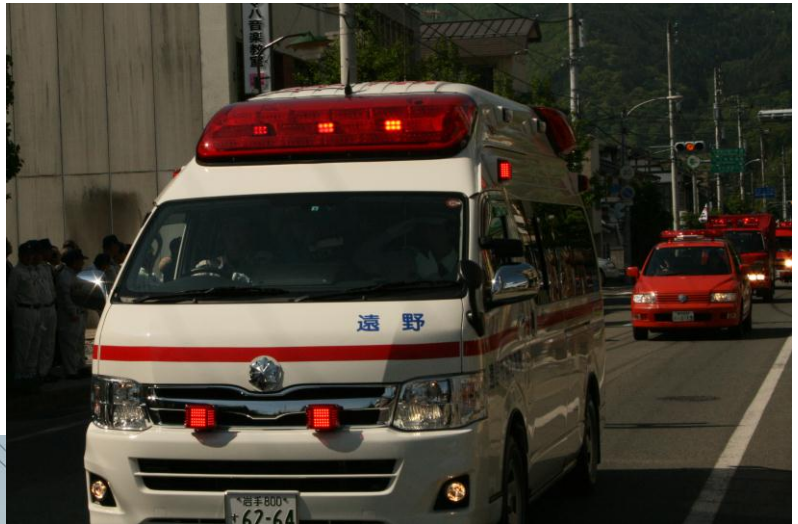
平成 25 年度遠野市消防演習 h25. 5. 26