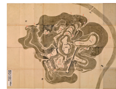
遠野城絵図 制作 宝永7(1710)年頃 絵図の大きさ 104㌘×121㌘

本コーナーでは、 あまり知られていない遠野の歴史文化をご案内。 遠野遺産なども紹介します。