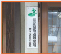
指定緊急避難場所