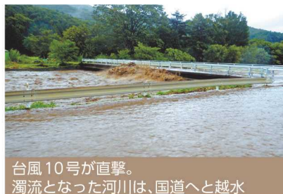
台風10号が直撃。濁流となった河川は、国道へと越水

東日本大震災(平成23年3月)や台風10号(平成29年8月)は、本市にも甚大な被害を及ぼしました。市では、防災訓練(9月上旬)や防災研修会(随時)などを実施しています。災害から命・財産を守るため、ハザードマップ等を活用しながら、実際の避難行動を確認しましょう。