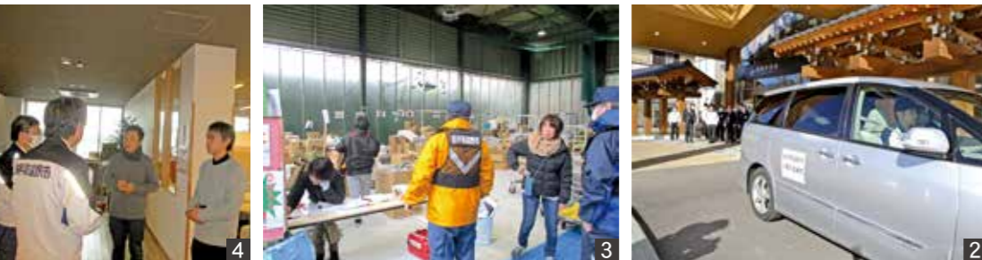
1_玉垣が崩れた七尾市の神社。輪島市や珠洲市から車で2時間ほどの同市でも家屋や道路が大きな被害を受けている 2_支援のため1月11日に出発した市防災危機管理課職員 3_金沢市の拠点に物資を搬入 4_現地の支援スタッフと打ち合わせ。今後必要な物資・支援について確認した