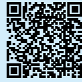
予約サイト QRコード

これまで市が実施してきたワクチン接種は3月で終了します。 接種を希望する人は、市予約サイトから予約してください。 ■問い合わせ 市新型コロナウイルス対策室(☎66-3570)