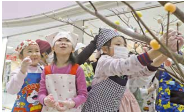
色とりどりの団子をみずきに飾り付ける園児