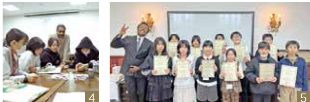
1_ CSAS校(姉妹校)では生徒が歓迎 2_ 派遣生がチャタヌーガ市長と名刺交換 3_ 現地学生と一緒に水族館を訪問 4_ レッスン中のゲームも英語で会話 5_ 最終日は修了証書をもらいました