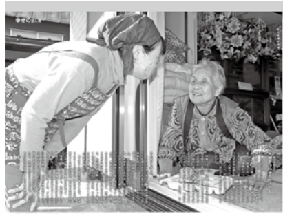
広報紙の部1位(4月号)

接種により健康被害があった時は相談を 予防接種法により救済を受けることができます。詳細は、市保健医療課(☎62-5111内線31)に問い合わせください。