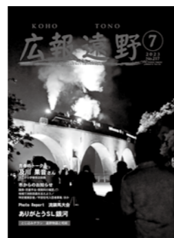
1枚写真の部3位(7月号)

広報紙の部1位の4月号は、高齡化が進む地域の支え合いについて取材。▽まちづくり団体▽企業▽自治会——などによる地域づくりの活動が誰かを支え、暮らしを豊かにしていることを紙面で紹介しました。