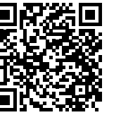
市ホームページ QRコード

4月から市役所で働く会計年度任用職員を募集します。 応募資格や選考方法などの詳細は、市ホームページまたはハローワークを確認するか、担当課にお問い合わせください。