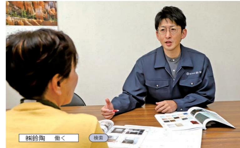
(株)鈴陶 働く 検索