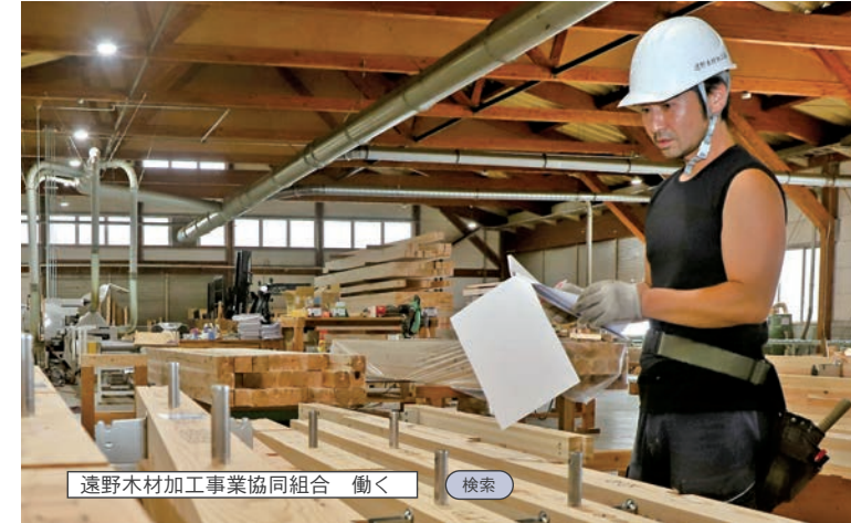
遠野木材加工事業協同組合 働く 検索