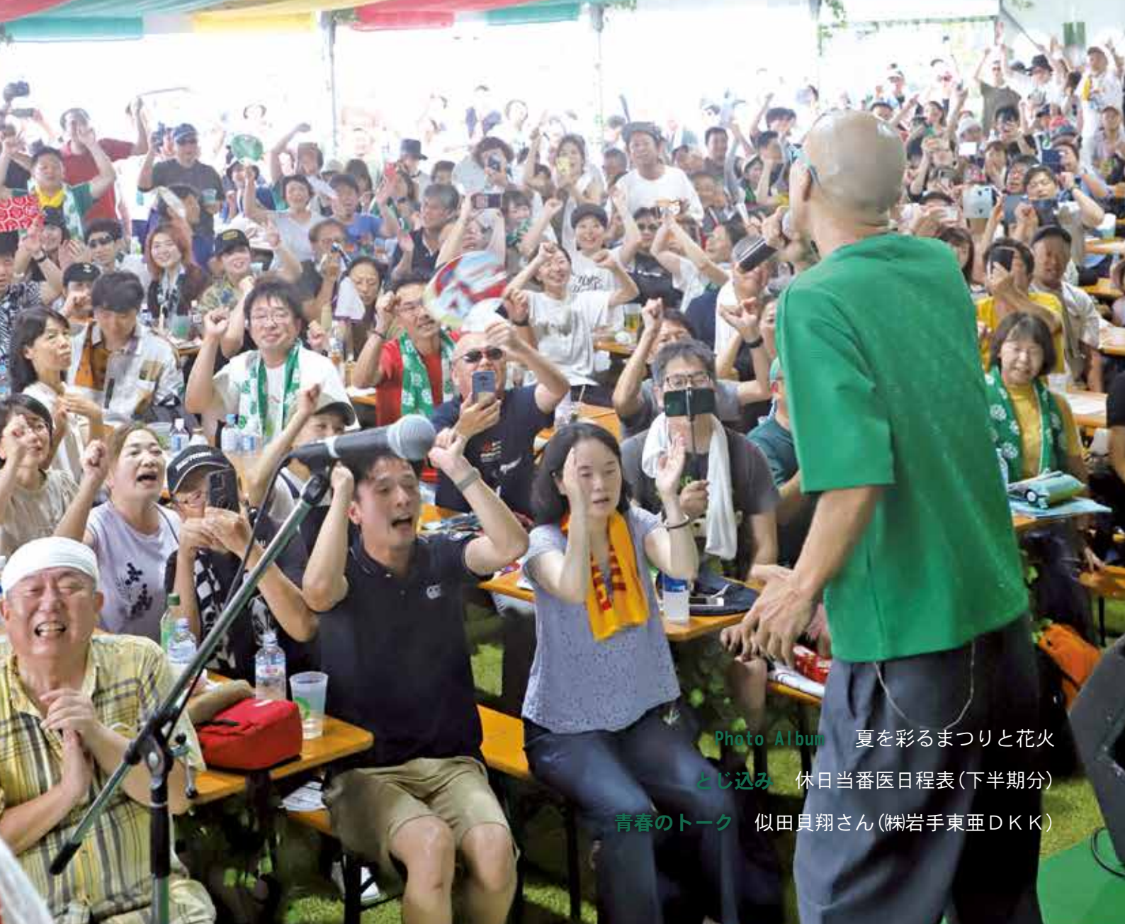
Photo Album 夏を彩るまつりと花火