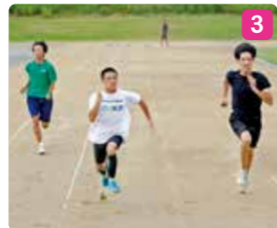
1_陸上競技部の皆さん 2_準備運動と体操後、走力を高めるラダートレーニングで体づくり 3_短距離はスタートと加速力を意識しながら自己ベスト更新を目指す