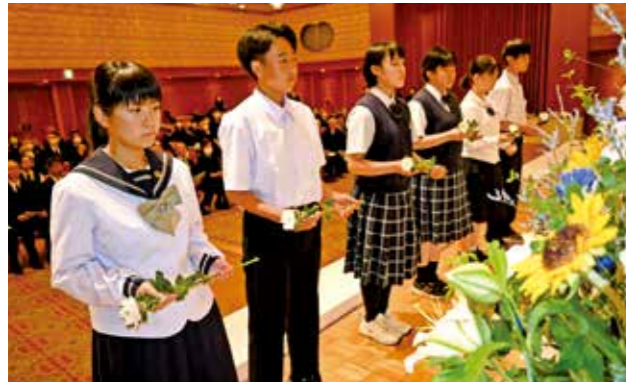
祭壇に白菊を献花し、恒久平和を祈った中学生