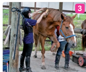
1_馬事研究会の皆さん 2_鞍上では前を向いて手綱を握る 3_活動後は馬に感謝を込めてブラッシング