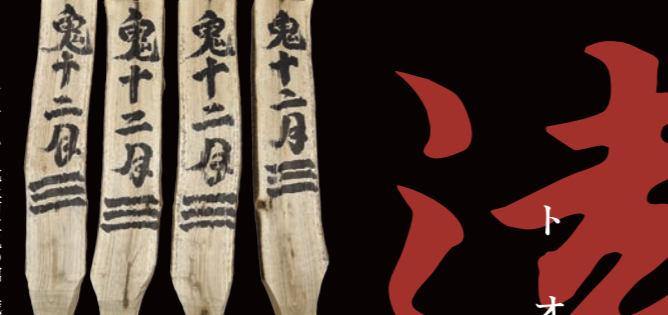
オニノハ 北上市立鬼の館 蔵