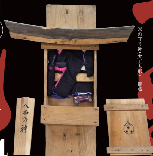
家の守り神(天人形) 館蔵