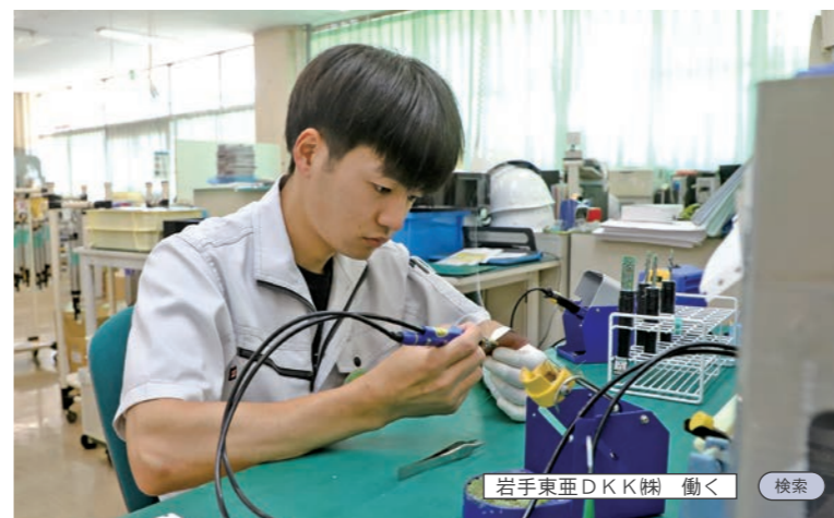
岩手東亜DKK株式会社 働く 検索