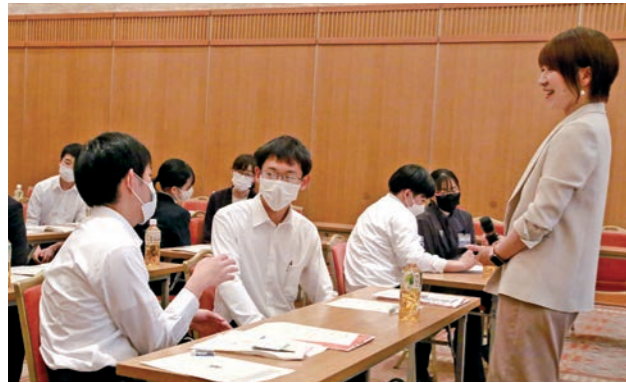
実技を交えながら社会人力を高める言葉選びを考える