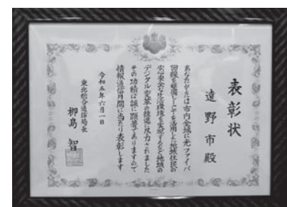
市民の生活環境改善が評価

※達曽部(特)は世帯所得が月額158,000円～487,000円までの人を対象とする特定公共賃貸住宅です