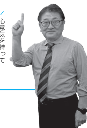
遠野市長 多田一彦