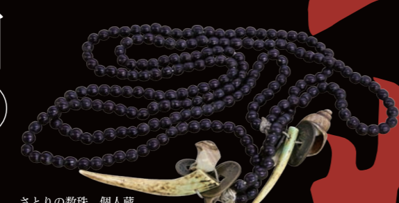
さとの数珠 個人蔵