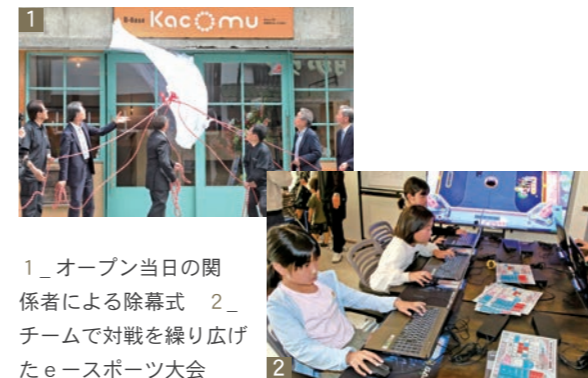
1_ オープン当日の関係者による除幕式 2_ チームで対戦を繰り返したeスポーツ大会