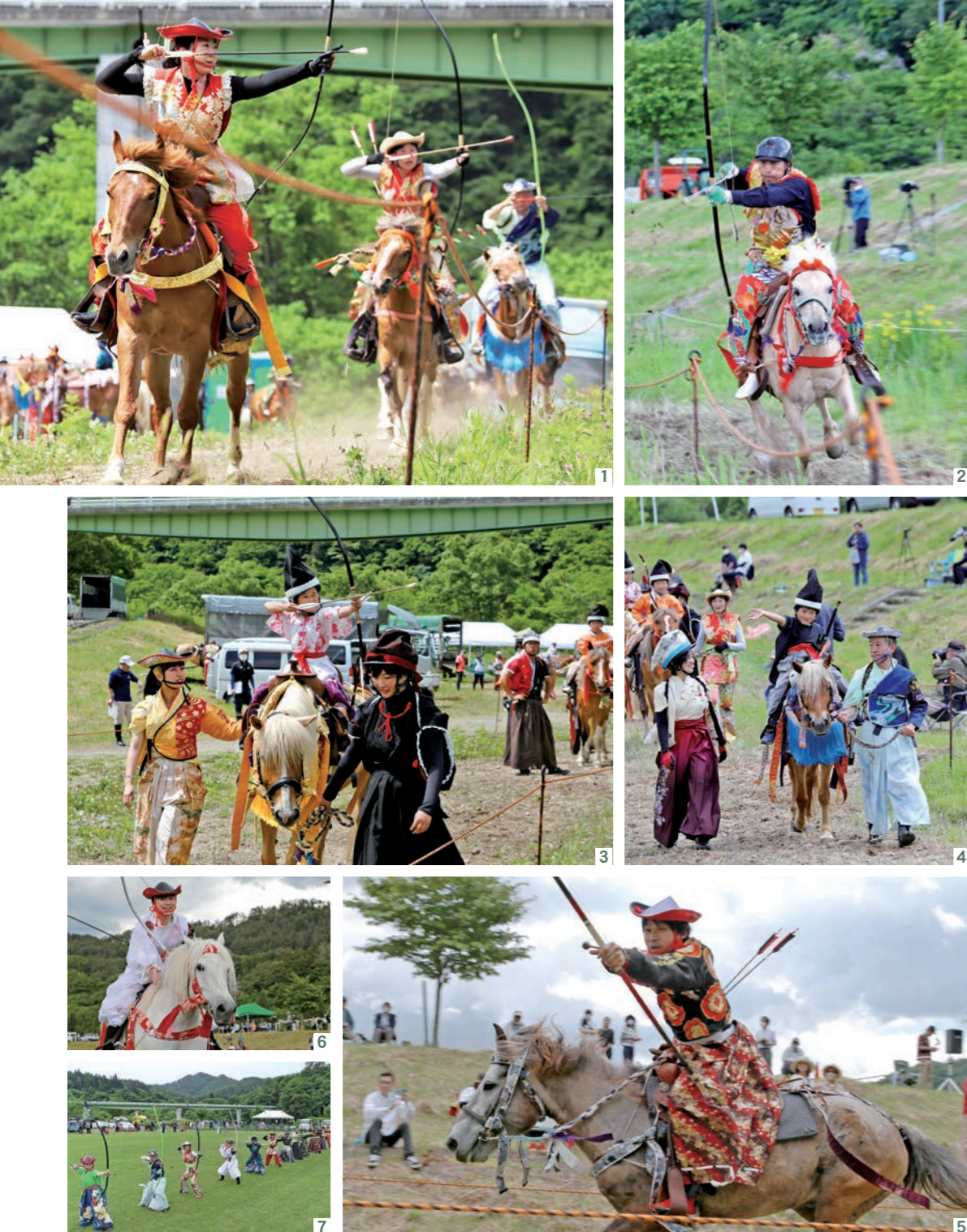
1_ 3人が連なった的を射る団体戦 2_ プロ級の部では進行方向右側の的を狙う「馬手射」が行われた 3_ 競技前にデモンストレーションで行われた「こども流鏑馬」 4_ アナウンスから名前を呼ばれると手を振り声援に応えた 5_ 真剣なまなざしで弓を射る 6_ 試合が終わるとねぎらいの意味を込め、馬をなでる 7_ 競技終了後、参加者全員による立射演武が行われた