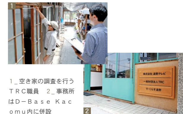
1_ 空き家の調査を行うTRC職員 2_ 事務所はD-Base Kacomu内に併設

■問い合わせ (一財)TRC(☎60-1310、メール trc-0428@tonotv.com)