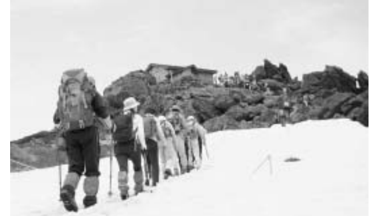
残雪を踏みしめ、頂上を目指す登山者(昨年の山開きから)

六月十日に山開きを迎える早池峰山。貴重な高山植物が数多く残る山として、多くの登山者に親しまれています。植物の見ごろを迎える時期は登山者が集中し、自家用車などの排ガスによる影響や、路肩駐車による植物の踏みつけなどが心配されることから、交通規制を実施しています。皆さんのご協力をお願いします。 ◆交通規制期間 六月十日(日)―八月五日(日)の土・日曜日、祝日(十八日間) ◆交通規制時間 午前五時―午後一時(大型車両は午後五時まで) ◆交通規制区間 主要地方道紫波川井線(花巻市大迫町内川井岳地内から川井村江繋地内の約十六キロ)なお、市道荒川高原早池峰線と規制道路との合流点には駐車場がありません。遠野側から自動車を利用する人は、大規模林道を利用して江繋の駐車場に駐車しシャトルバスを利用してください。 ◆交通規制対象外車両 乗合バス(路線バス、シャトルバス)、タクシー、ハイヤー、二輪車、警察が許可した車両 ◆その他 ①早池峰地域では、携帯トイレの使用を推奨しています。携帯トイレは、峰南荘、河原の坊総合休憩所、小田越監視員詰めで取り扱っています。②貸切バス、観光バスも規制の対象となりますので、シャトルバスを利用してください。シャトルバスを団体で利用する場合は、台数確保のため、一週間前に予約が必要となります。(予約先 岩手県交通株式会社 ☎019-654-3355)