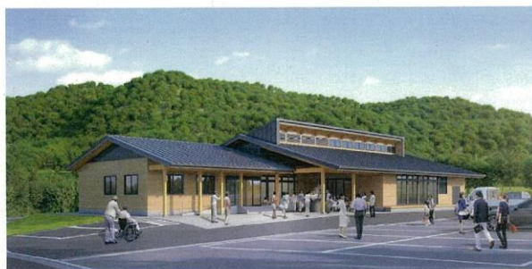
建物外観イメージ