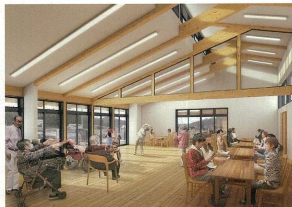
交流ホールイメージ