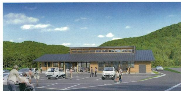
建物外観イメージ