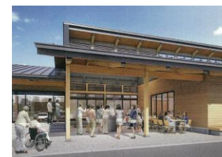
軒下スペースイメージ