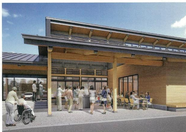
軒下広場イメージ