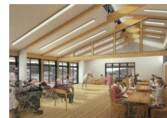
交流ホールイメージ