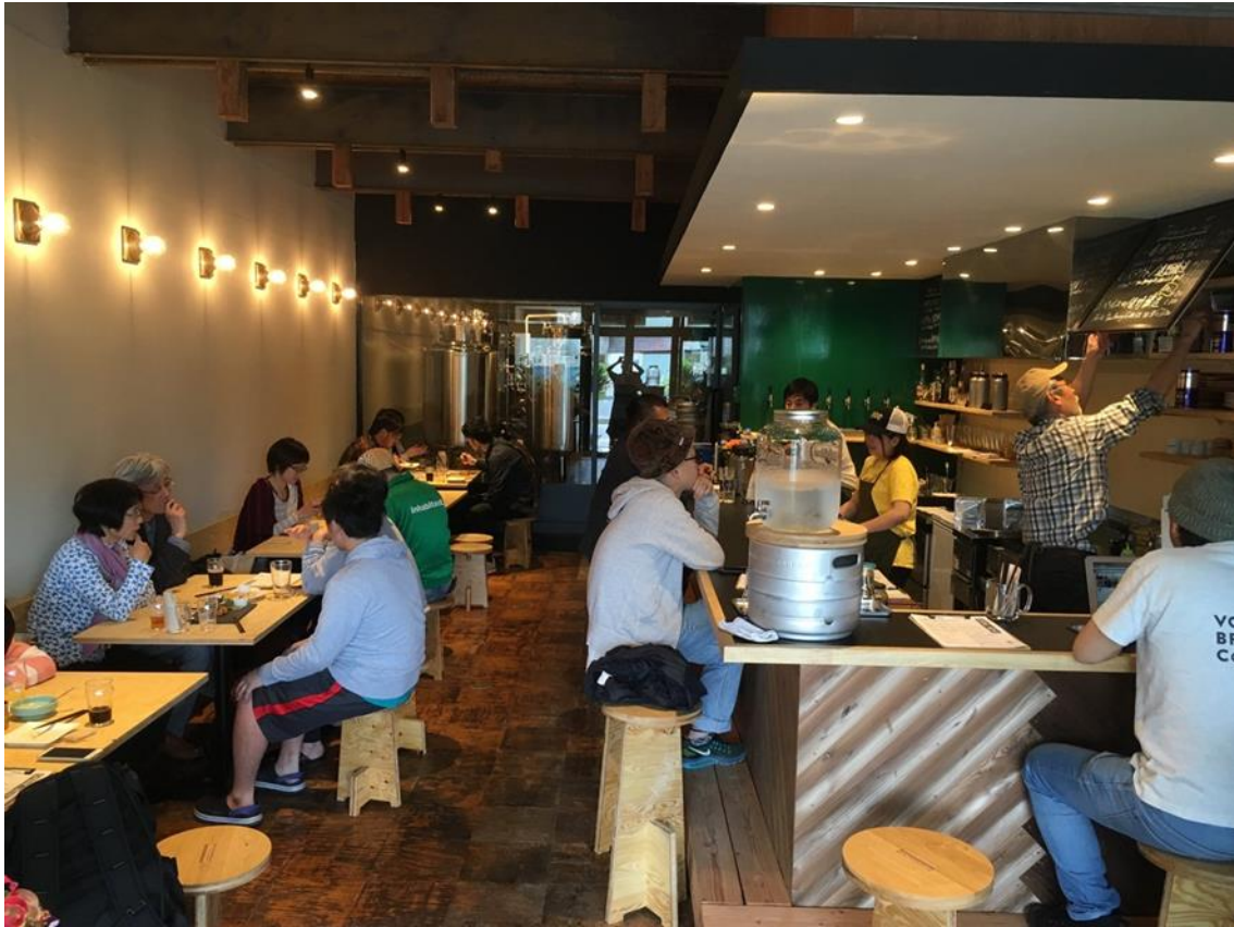
元酒屋をリノベーションし店舗兼ビール醸造所として活用している市内の事例