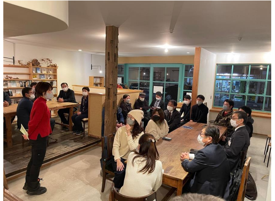
空き店舗を交流スペースとして活用している市内の事例