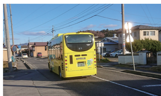
交通弱者への対策が早急に必要

問 …………… 高齢者の交通手段が乏しく、生活に不便をきたしているが、市の方策を伺う。 答(市長) …………… 深刻な問題と捉え、いろいろ模索している。