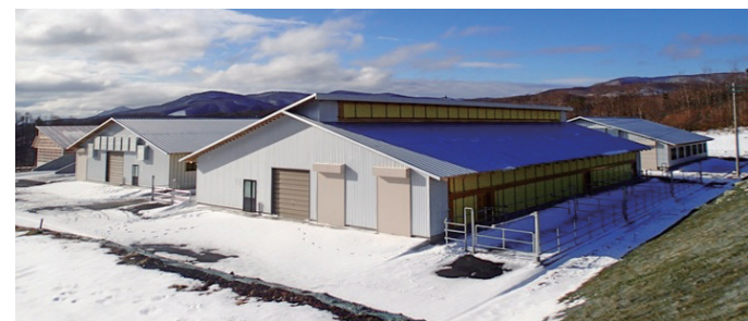
平成26年から稼働している大野平キャトルセンター

問 …………… 粗飼料自給化促進に 答(市長) …………… 色々なものに手を挙げたい。ここを乗り越えようと必ずチャンスが来ると思っている。本市事業に対する国策の補助を有効にもつてきたい。 問 …………… 下水道事業を運営する自治体を対象とした、下水汚泥の肥料化に向けた国の支援策に手を挙げるべきと思うが。 答(市長) …………… 同感だ、一緒に考えたい。多様化するニーズに合わせて新たなビジネスとして展開していきたい。