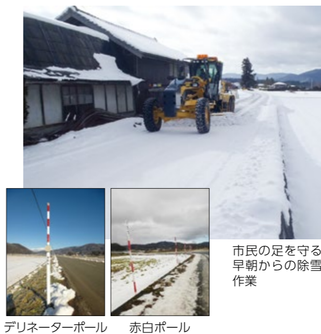
市民の足を守る早朝からの除雪作業

問 事業の目的は。肥料・飼料高騰による畜産経営の圧迫が続いている中で、自給飼料の増産や市内畜産経営体と畜産振興基盤(担い手・農地等)の現状把握と今後の畜産経営の分析を行うためのアンケート調査を実施し、持続可能な中・長期的経営プランを作成する。 答 現状を踏まえ、喫緊の課題に即した対策が必要ではないのか。 問 市内の自給率を個別に調査し、コントラクター(農作業委託)事業などで粗飼料自給を高めることや、余剰