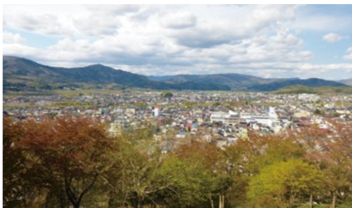
鍋倉公園から見た遠野市中心市街地

答(市長) …………… 中心市街地活性化事業の要件は、土地区画整理事業、市街地再開発事業、道路等の公共施設の整備計画が必要となる。今のところそのような計画が無いので計画認定を受けることができない。計画が無くても、現状に照らし合わせながら必要な課題解決を行っていく。