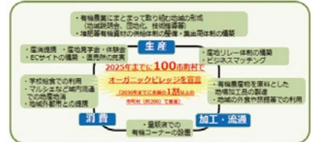
農水省は、有機農業に地域ぐるみで取り組む産地の創出に取り組む市町村の支援に取り組んでいる。

※オーガニックビレッジ 有機農業の生産から消費までを一貫し、農業者のみならず事業者や地域内外の住民を巻き込んだ地域ぐるみの取り組みを進める市町村のこと