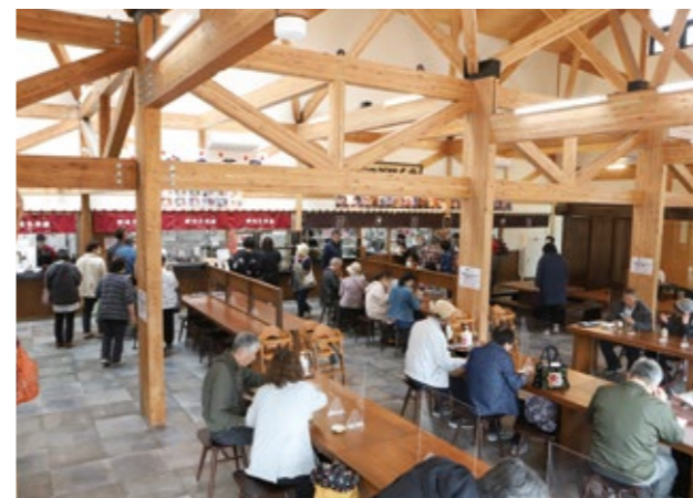
いつも盛況の風の丘「フードホール」

り、来年7月に「遠野ふるさと公社」を「遠野ふるさと商社」へ事業継承し1社体制にするべきではないか。