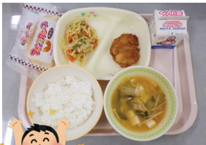
今日の給食はからあげだ！