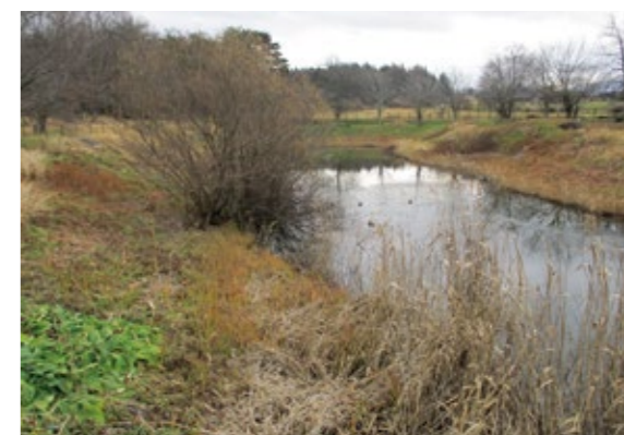
整備が必要な調整池

問 …………… 現在の運動公園施設への所感は。 答(市長) …………… 近隣市町村の施設を見て、残念ながら差があると感じている。多額のお金がかかるがいろいろな方法で資金を見つけて、できるだけ早く整備したい。