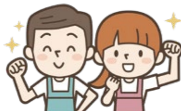
介護福祉専門学校できるかな

答 (市長) …………… 職員一人当たり3%程度月額9千円の賃金引き上げが実施され、恒常的な加算になっている。