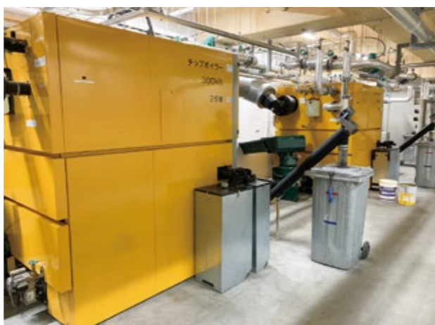
一番最初に六価クロムが検出された市役所新庁舎

問 …… 答 (市長) ……まずはその修正する、改善するということが一つ最も重要なこと。そして、改めて前政権だけではなく、市役所もそれこそ議会も一緒にやってこれまでの検証、反省をしてより良いまちにしたい。