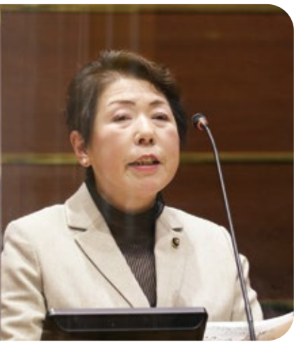
昆 明美 議員