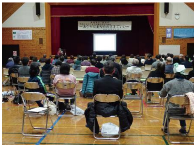
11/20 (日) たんぽぽ会 (遠野地区不登校を考える親の会) 主催の講演会には、多くの方が参加しました。

問 …………… 調査では、不登校になる要因のひとつとして、「先生との関係」が指摘された。学校設置者として、どのように受け止めるか。 答 (教育長) …………… 非常に残念。指導側の思いや狙いがうまく伝わらず、子どもたちに不安や不満を抱かせてしまうケースも見受けられる。