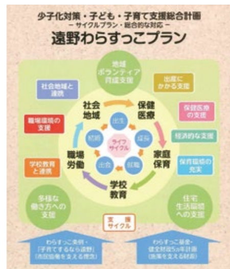
わらすっこプラン

高等部分教室の設置については、岩手県特別支援学校整備計画で示されている。総合的な視点により検討し、岩手県教育委員会の動向を注視しながら教育環境の充実に取り組んでいく。