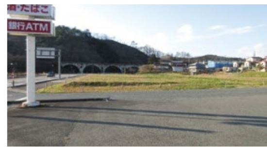
造成工事が完了している宮守銀河市営住宅建築予定地