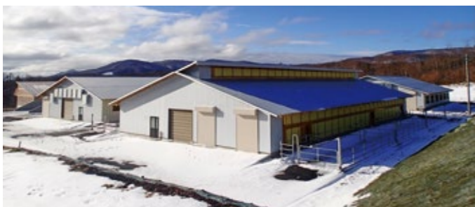
平成26年から稼働している大野平キャトルセンター