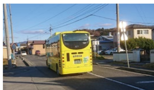
交通弱者への対策が早急に必要