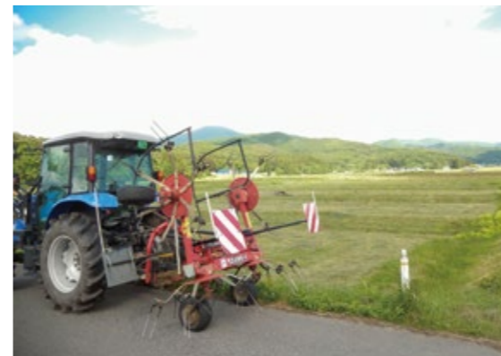
直接交付金が減額されても維持されている水田牧草地

答 (市長) ……遠野のすばらしい環境を守っている力は、多面的活動組織や仲間組織等の大変な苦勞により守られている。非農業者も参加して、小さな拠点とあわせ各地区での取り組みを進めたい。