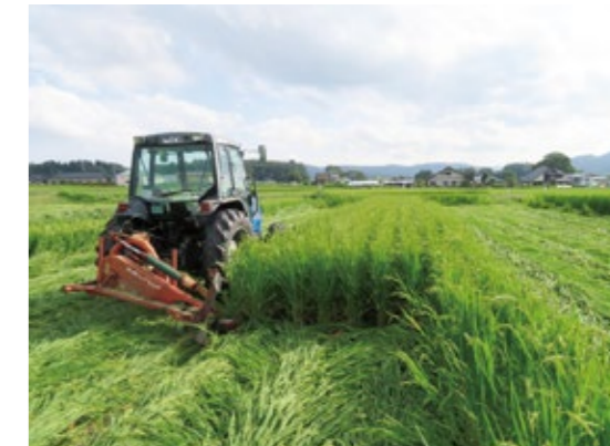
ホールクロープサイレージ刈取り (牛の餌として利用する稲の刈取り)

答 (市長) ……需要と供給の構造的な問題から、個性を生かした経営のあり方の追及が必要。多額の設備投資による元金償還の滞り等に対応を余儀なくされている場合は、相談してほしい。国・県の動向を見据えて方針を定め、新しい時代に遠野の個性をもっと向かって行きたい。