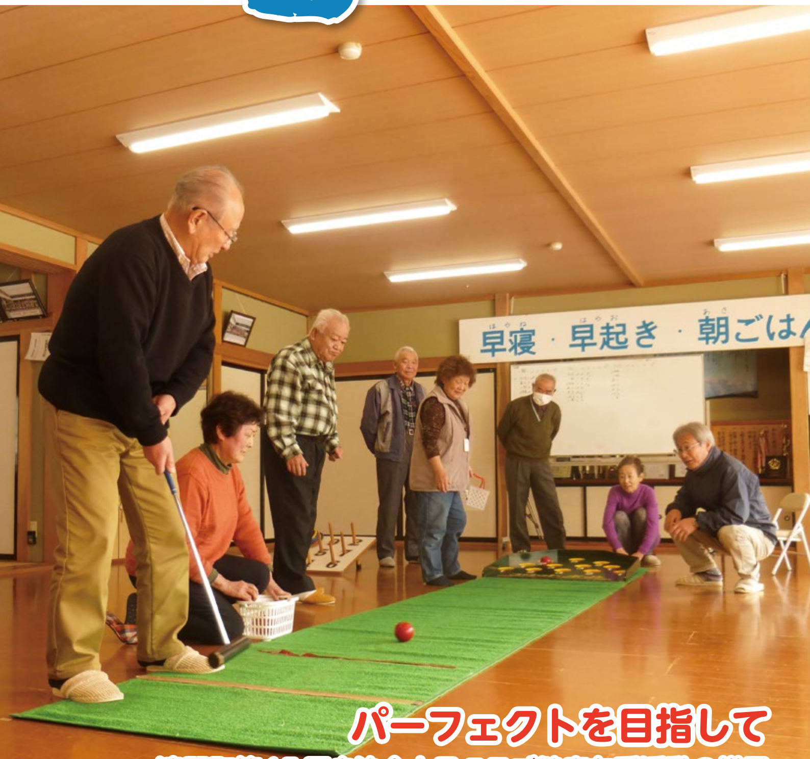
パーフェクトを目指して 遠野町第15区自治会大日クラブ健康友愛活動の様子