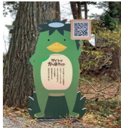
カッパ淵の案内看板 (冬期間は雪のため撤去中)