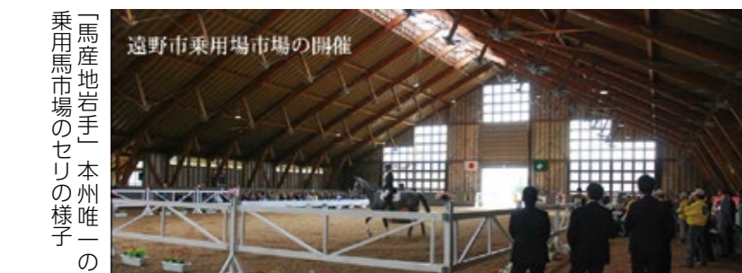
遠野市乗用場市場の開催