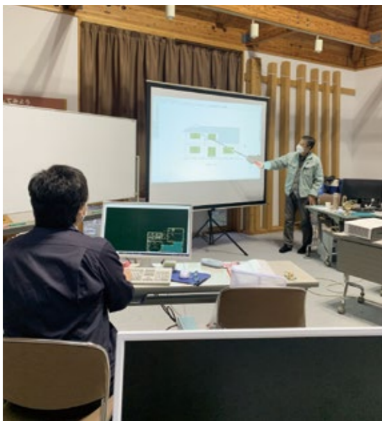
訓練校では基礎から最新技術まで学べます。

問 …………… 学び直しについて、遠野高等職業訓練校の県内でも稀な取り組みを支援する立場からどう評価する。 答(市長) …………… 遠野高等職業訓練校は大変重要な場所である。年間延べ千人を超える受講とその過半が市外からの生徒であり、市内企業への就職に繋がっていることは、市の発展に大きく寄与している。