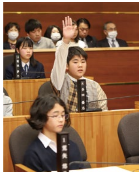
わらすっこ議会の一コマ 子ども・若者の声を各施策に反映させることが重要