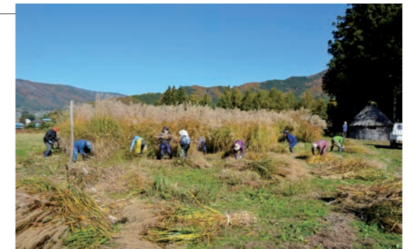
昨年の茅刈り体験会の様子

『遠野物語』の里、土淵山口集落で「茅刈り体験会」を開催します。はじめての人も大歓迎。刈った茅は、デンデラノの休憩所の屋根葺き替えに活用します。