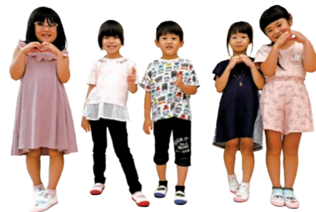
光の園幼稚園 5歳児のみなさん