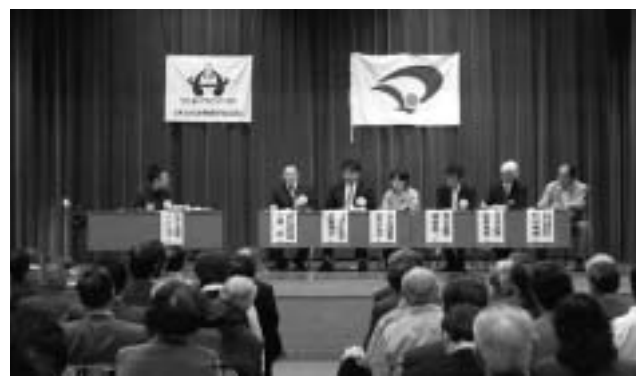
昨年11月、大仙市で開催された北東北地域連携フォーラム