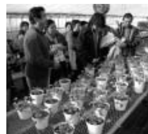
試作中の冬作品目ランタナキュラスについても意見交換

同センターでは、秋田県内の花き生産者の九割から育苗を委託されており、およそ四百万本の花苗が育てられています。研究・実証も行っていて、近年躍進著しい「秋田の花」の中核を担っています。 今回は、トルコギキョウ育苗中の追肥や温度管理などの技術を中心に学びました。 まだ市内では確立されていない技術もあり、生産者は質問をしながら熱心にペンを走らせていました。