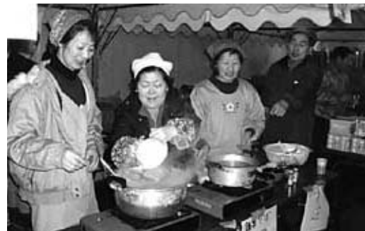
住民手作りの10店の屋台が並んだ前夜祭

暖冬の影響で、メインイベントの雪合戦大会が中止となったものの、音語りコンサートや新ローカルヒーロー「まぶりと牙」が飛び入りしたビンゴゲーム大会、住民手作りの屋台村など、参加者は冬のまつりを楽しみました。