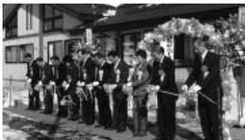
施設の完成を祝い関係者がテープカット

上郷小学校の敷地内に建設された同児童館は、木造平屋建てで延べ床面積二六七平方メートル。事業費は四千九百八十二万円。建設にあたっては、地域住民で組織する「明日の上郷小学校を創る会」と実施設計などについて協議を重ねてきました。