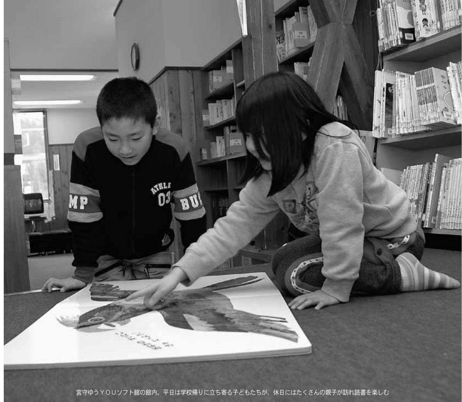
宮守ゆうYOUソフト館の館内。平日は学校帰りに立ち寄る子どもたちが、休日にはたくさんの親子が訪れ読書を楽しむ

◆市立図書館(本館) ☎2340 ◆宮守ゆうYOUソフト館(分館) ☎2012 ◆開館時間 午前9時から午後5時まで (本館は金曜日に限り、4月～9月の間は午後7時まで、10月～3月の間は午後6時まで開館) ◆休館日 毎週月曜日、月末日、年末年始、特別整理日 ◆本の検索や予約は、市のホームページから「図書館」のページに移動してください(4月から利用可能)