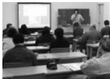
講座では、販売単価ごとの手取り額も試算

一月二十、二十七日の二日間花き栽培の導入を検討している人や導入後もわからない人などを対象にした「写真で学ぶ花づくり」講座を開催しました。初級と中級に分けた講座には、二十七人が参加。 この講座では、ただ話を聞いたり文字を読んだりするのでは