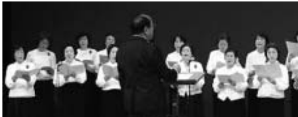
11月の市民芸術祭は展示・舞台上で技術技能を発表します