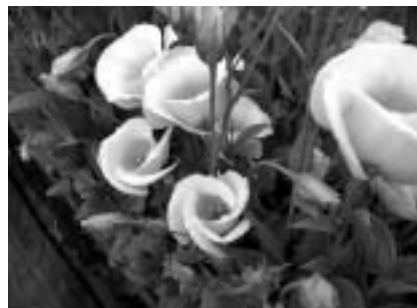
良苗作りが欠かせないトルコギキョウに さらなる一歩

ホームページ( http://www.tonotv.com/members/ast1055/ )で、市内の農業情報などを配信中