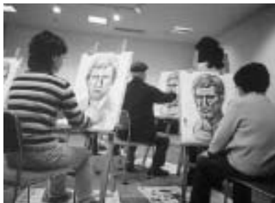
石膏デッサンの様子

体的な事業運営を行っていきま す。また、親睦交流会を開催し て会員相互の親睦も深めていき ます。 遠野の芸術文化を高め、幅広 い活動につなげるために、ぜひ 加盟してみませんか。 加盟を希望する団体(個人)は 所定の申込用紙に必要事項を記 入し、社会教育課芸術振興係に 提出してください。申込用紙は、 市民センター、各地区センター にあります。