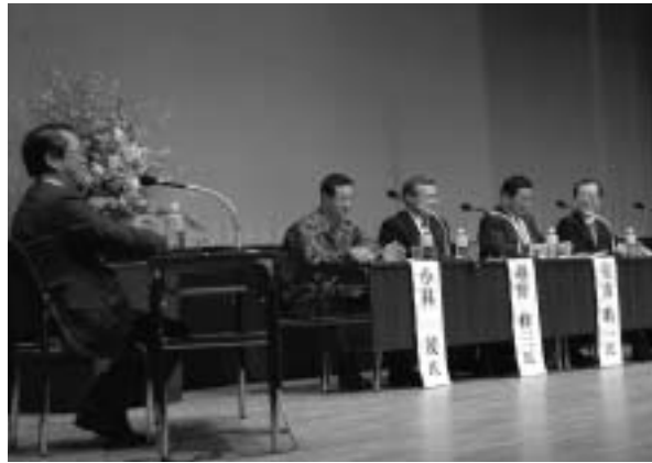
防災の拠点づくりについて意見交換したパネルディスカッション