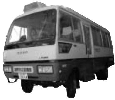
●移動図書館車「やまどり号」 約1,500冊の本を積んで、市内を定期的に巡回しています

また、図書館では市内に十校ある小学校にそれぞれ二百冊ずつの本を貸し出しています。定期的に入れ替えを行いながら、学校図書館の充実にも一役買っています。