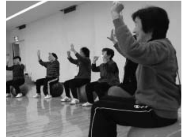
楽しみながらバランスボールを体験