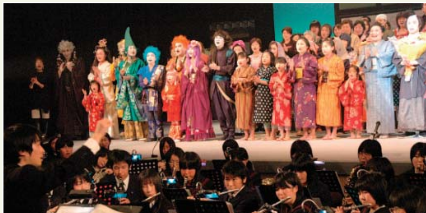
キャスト・スタッフ全員でファンタジーの歌を合唱し、感動の舞台は幕を閉じました