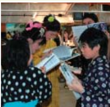
本番前の楽屋。せりふの確認に余念が無い子役たち