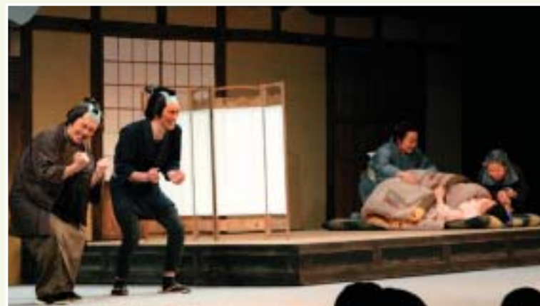
新しい命の誕生とともに、大切な命との別れも経験する

第三十二回市民の舞台「遠野物語ファンタジー」いのち輝く花いちりんは二月三・四の両日、市民センター大ホールで開かれ、二千九十九人の観衆を魅了しました。今回は、江戸時代の遠野の町場を舞台に、目の見えない主人公サキを中心に、命の尊さや家族の絆を描いた物語で、キャスト・スタッフ総勢三百七十二人が作り上げた感動の舞台に惜しみない拍手が送られました。