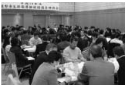
いじめについてグループで討議

一月三十日、市生徒指導推進協議会研修会が開催され、教育関係者・保護者・関係機関から約百人が参加しました。 前半は十グループに分かれて今起きている「いじめ問題」について、「好ましい人間関係づくり」をテーマに話し合いをしました。大人がときには厳しく教えること、命の大切さを教えること、「いじめを許さない決意が必要」など、活発な討議が行われ