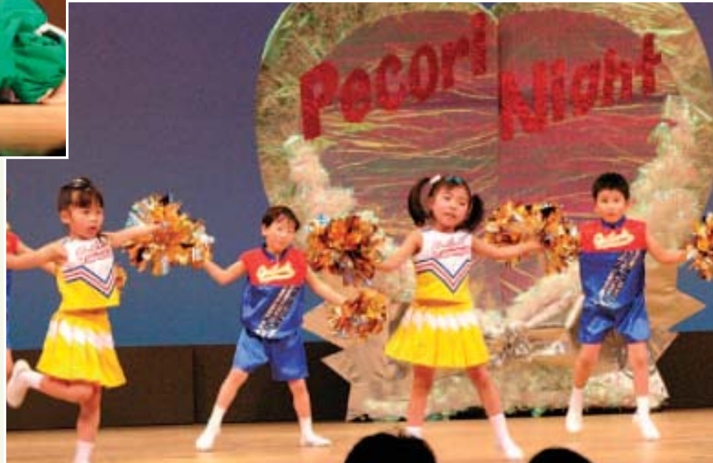
左上=かわいいカエルの家族を演じた遠野保育園の劇遊び「999匹のきょうだい」 左下=見事な刀さばき。附馬牛保育園の遊戯「一剣」 上=テンポの良いリズムで元気に演じた青笹保育園の表現「Pecori Night」