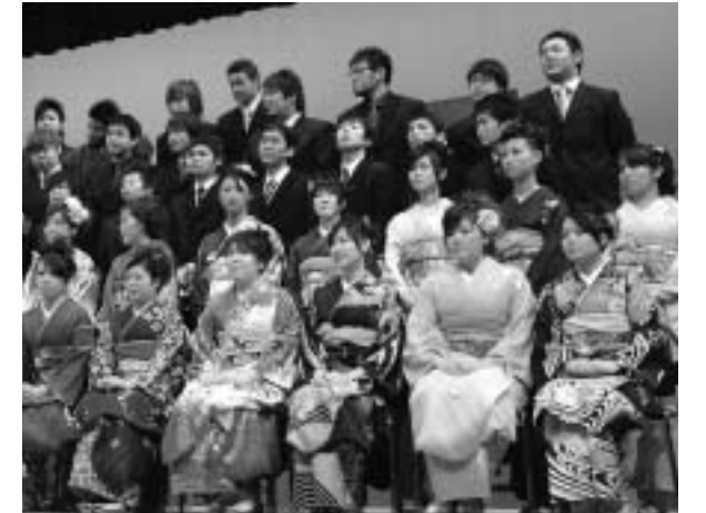
式典終了後には、旧友らとの記念撮影