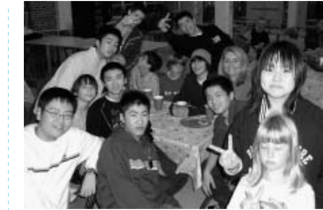
学校主催の歓迎会で校長先生を囲んで和やかに