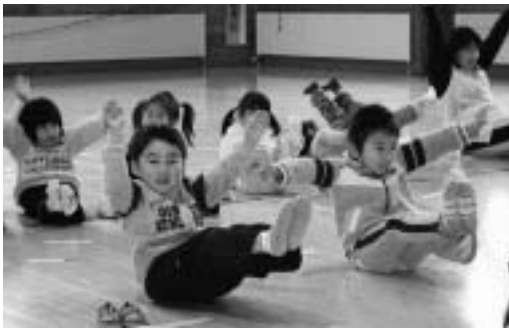
おしりでバランス、ハイ・ポーズ!!

第1回目の教室では、片足やお尻で体を支えたり遊びを加えたストレッチをしたりと、平衡感覚や体の柔軟性を高める運動を行いました。園児らは「頑張れ」とお互いに声を掛け合いながら、元気いっぱい体を動かしていました。