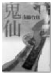
鬼仙 南條 武則 著

なお、一階新聞雑誌コーナー・視聴覚ホール・二階閲覧室・大会議室は、通常通り使用することが出来ます。