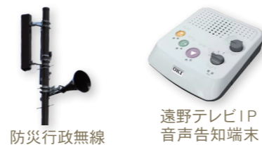
防災行政無線 遠野テレビIP音声告知端末

「防災行政無線」「遠野テレビIP音声告知端末」でも、今まで通りお知らせを聞くことができます