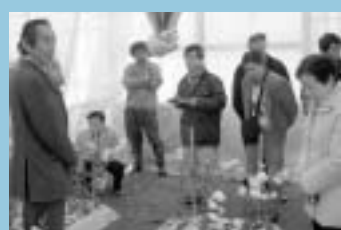
12月4日に開催した冬目研修には、20人が参加(山形県新庄市)

「ベゴ」で遊休地解消—里山簡易放牧場 「牛を里山に放牧して、エサ給与など管理労力軽減を図りたい」。昨年度、数百件の市内生産者を訪問して出された意見の一つです。 このことから里山放牧に取り組み生産者グループに、電気柵の設置支援を行いました。①里山の遊休地活用②軽減した労働力で増頭③家畜ふん尿処理が容易④受胎率の向上など、複数の効果が期待されます。設備は、触るとパチッとする電線を草地のまわりに巡らすなど、比較的簡便。集落で管理することで一人の生産者が病気などで作業できなくなっても牛を飼い続けられるという利点があります。 〔実施三組合の概要と三年後の計画〕