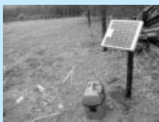
簡易放牧場に設置されたソーラー電気柵(附馬牛町)

「ベゴ」で遊休地解消—里山簡易放牧場 「牛を里山に放牧して、エサ給与など管理労力軽減を図りたい」。昨年度、数百件の市内生産者を訪問して出された意見の一つです。 このことから里山放牧に取り組み生産者グループに、電気柵の設置支援を行いました。①里山の遊休地活用②軽減した労働力で増頭③家畜ふん尿処理が容易④受胎率の向上など、複数の効果が期待されます。設備は、触るとパチッとする電線を草地のまわりに巡らすなど、比較的簡便。集落で管理することで一人の生産者が病気などで作業できなくなっても牛を飼い続けられるという利点があります。 〔実施三組合の概要と三年後の計画〕