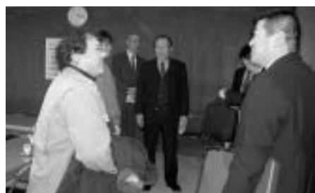
アストなどの関係者が首都圏市場を訪問してのPR活動

ホームページ( http://www.tonotv.com/members/ast1055/ )で、市内の農業情報などを配信中