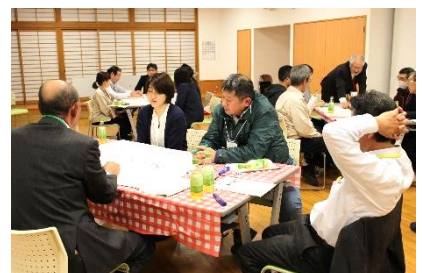
グループ形式は、グループに分かれ、気軽に話せる雰囲気で行います。

【問合せ先】 遠野市議会事務局 Tel 62-2111 E-Mail : gikai@city.tono.iwate.jp