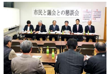
対面形式は、議員と参加者が対面で座り、一問一答します。