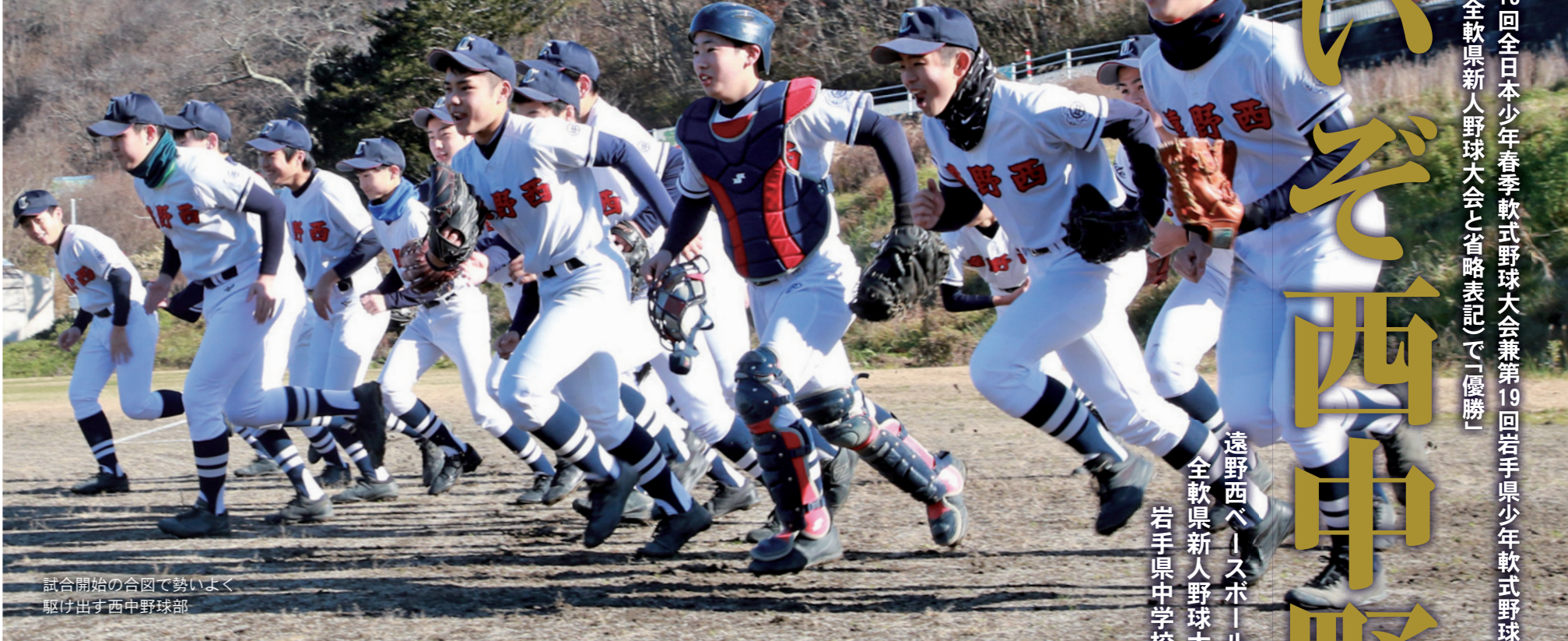
試合開始の合図で勢よく駆け出す西中野球部