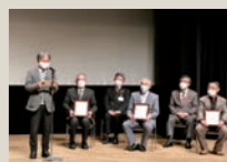
昨年の交付式の様子

日付 / 12月13日(月) 場所 / 市民センター大ホール ※「遠野文化遺産セッション」内で実施予定