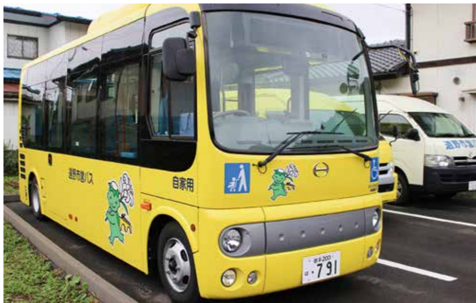
地域交通はどこの地区においても重要な課題

「市営バス」「福祉有償運送」の免許更新や、「路線バス」「デマンドバス」の路線見直等のほか、生活交通の確保対策について広く協議、検討している。 乗降調査を行うようだが、この公共交通会議には、地域の代表やバス利用者も参加しているか。 バス利用者から担当課に寄せられた要望を持って話し合いをしている。 免許返納者が増えているため、家族も大きな影響を受けている。 実態調査を行い、ど