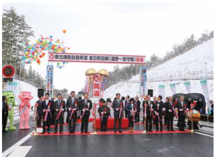
平成27年当時の安倍首相も出席された金石道「遠野～宮守間」開通式の様子

問 地方の小さな自治体の首長として、国会議員や国の各省庁との太いパイプの構築や連携の重要性については。