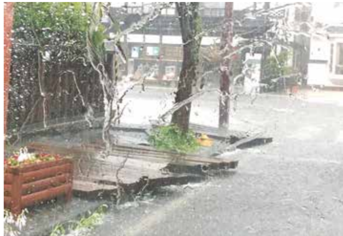
7月豪雨 大工町の歩道の様子