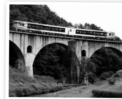
令和2年度最優秀作品『民話の里に』