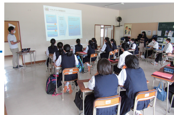
高校生の早期医療費給付事業を求む中、勉学に励む遠野高校生

「未婚化」や「晩婚化」の影響が大きく、背景には経済的な不安定、出会いの機会の減少、男女の仕事と子育ての両立の難しさ、家事・育児の負担が女性に偏っている状況、子育ての孤立感や負担感と費用負担など、子育ての希望の実現を阻む要因が絡みあっている。このことから、子育て分野の取り組みのみでなく、全ての分野で横断的な展開が重要である。