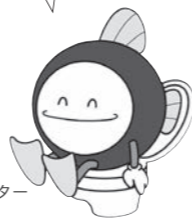
下水道マスコットキャラクター「スイセイ」

※「改築」と「リフォーム」の違い 改築 …住宅を取り壊した土地に新たに住宅を建てること リフォーム …建物の基礎を残して部分的な修繕を行うこと