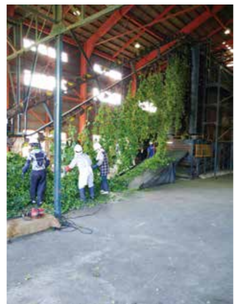
ホップ施設での収穫作業

【現況】 組合員25名 面積23ヘクタール キリンビール(株)調達部からは現在の生産量40tから60t(10ヘクタール増)への増産を要望されている。 今後は新規圃場の確保と共に大型機械導入による収穫対応を図るために圃場の大型化が必要である。