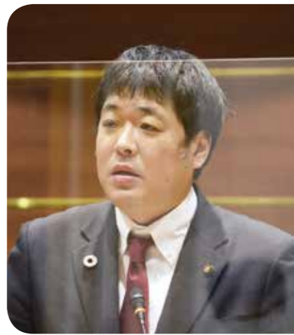
小松 正真 議員