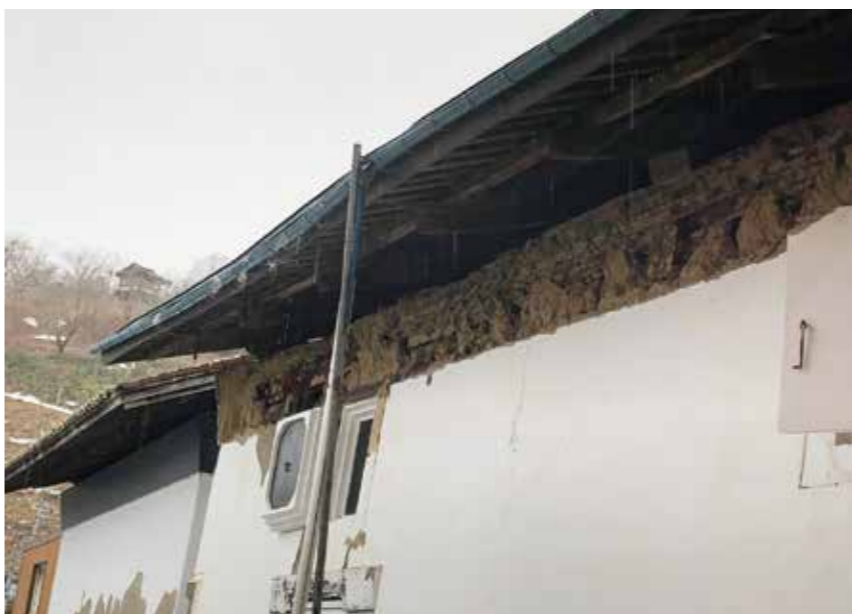
安全面・景観面から改修する土蔵

この構想は町屋として蔵と庭を一体とした文化を発信する。さらに安全を担保する最小限の改修工事が必要と考える。