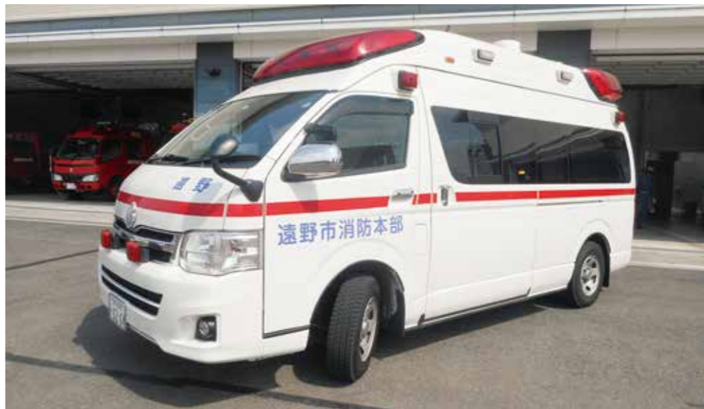
遠野消防署の高規格救急車 排気量が大きく室内で救急隊員が立ったまま処置ができる広さを有している

問 今回の高規格救急車の購入により市内で何台所有することになるか。 答 遠野消防署3台、