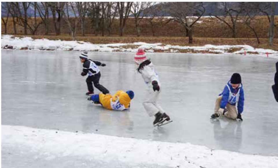
天然氷スケートリンクで行われた遠野の冬の風物詩「清養園氷上まつり」子どもから大人まで楽しんだ。

ンドゴルフ場は継続するが、スケート場と入浴施設は令和3年12月に廃止予定。綾織町民やスケート関係団体、特に利用者にも周知はかり、ご理解いただく。