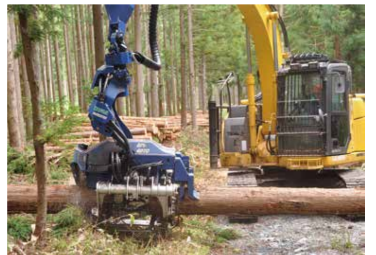
機械化によって進められる伐採作業現場