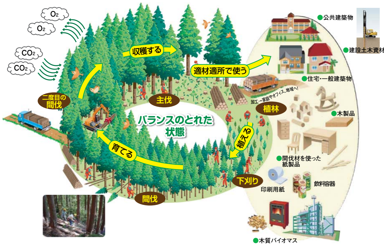
森林資源の循環利用のイメージ（林野庁のHPより）