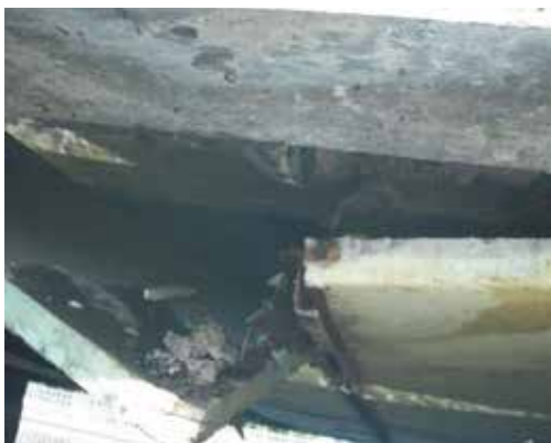
老朽化が目立つ入浴施設下部

時短営業・サウナ閉鎖など感染症対策を施した結果、令和2年度の入浴利用者数が減った。縮小営業について特に苦情は寄せられていない。