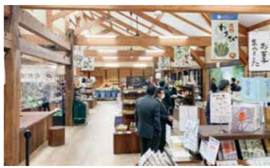
改修が終わった道の駅風の丘 指定管理料は増額