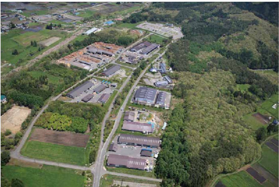
遠野木材工業団地の全景

例えば、林道から近くて木材搬出が容易な森林は、人工林としてカラマツやスギを再造林し、木工団地等に供給して、手入れが難しい奥山は強度間伐を行い、山の力を強めつつ、徐々に広葉樹の山に移行し、国土保全の機能を高めていく。こうした考え方から、持続可能な森林経営が可能になる。