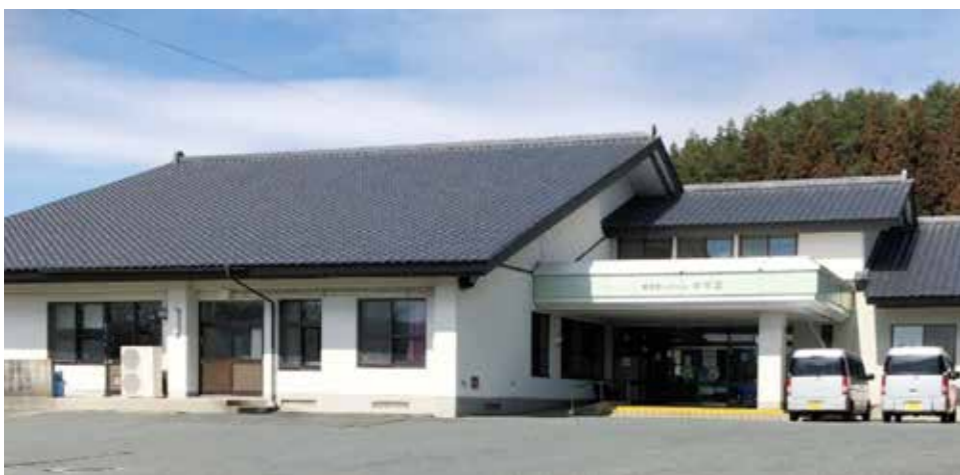
養護老人ホーム 長寿の森 吉祥園

問 特養ホームの状況は。また、待機者は何人か。 答 (市長) …… 市内における特別養護老人ホーム入所希望者は、令和2年4月時点において172人であるが、入所の必要性の高い在宅で待機している要介護3以上の方は52人、そのうち、要介護4・5の方は20人。