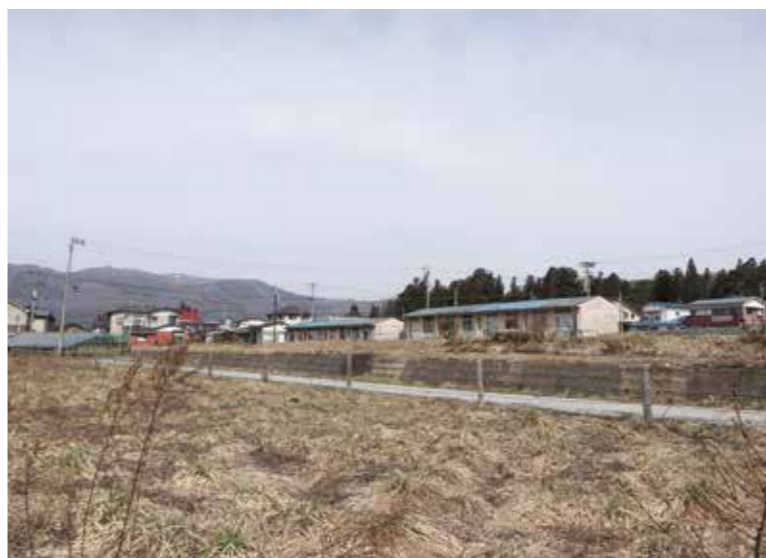
次代を担う若者定住に向け市有財産の有効活用を (写真は八幡住宅跡地)

ご提案の特命組織は十分検討に値する事であり、よほどの覚悟を持って臨むべきと考え、前向きに検討したい。