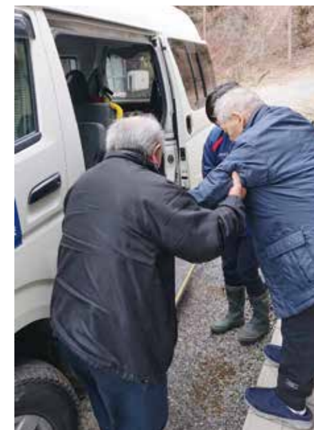
急がれる交通弱者の対応策