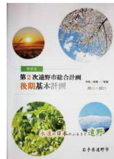
各家庭に配布された第2次遠野市総合計画後期基本計画の概要版