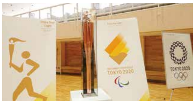
遠野市教育文化振興財団、遠野みらい創りカレッジ、遠野施設管理サービスと市の4社連携による共同イベントとして開催された共生社会フォーラム in との

問 ..... 避難行動要支援者の個別計画の作成後は、実際に防災訓練を行う等、実効性を高める取り組みが必要では。