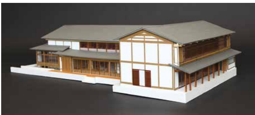
「こども本の森遠野」本館の模型 (写真右側が一日市通りに面する)