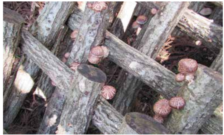
市内原木しいたけ生産者のほだ場(評価の高い若手ごっこ)

求められている。原木しいたけ生産者のほだ木需要に比べ、ほだ木と種駒への助成など支援して原木しいたけ生産量の確保を図る。また、新型コロナウイルスの影響を受ける根ワサビについても生産者への支援を打ち出したい。