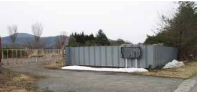
観光にも教材としても活かされていない金取遺跡