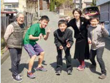
快都くん(左から二人目)を囲んで

この春、念願の神奈川大学駅伝部に入り箱根を目指す第1歩を踏み出しました。願いが叶ったのは本人の頑張りはもちろんですが、思いを言葉にしたことでその方向へ進んでいくという言葉の力を感じました。 方につけたからだと思っています。 今まで、息子に関わってくれた皆様、応援してくださいました。感謝の言葉を伝えたいです。このご恩はいい走りです。元氣やパワーを与える存在となり、遠野をアピールして、地域や陸上界を盛り上げていこうと思います。