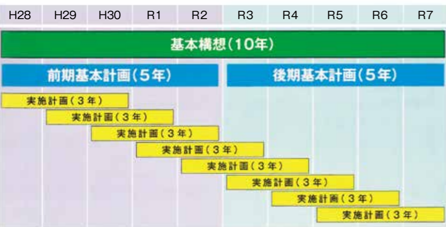
平成28年度から令和7年度までの遠野市総合計画の流れ (基本構想10年、前期・後期各5年) 毎年度見直し

6つの策定方針を掲げ、ワーキンググループや総合計画審議会など各方面の意見を可能な限り反映させた。高度情報化の進展、異常気象による災害の頻発、新型コロナウイルス感染症に象徴される新たな脅威の直面で、今後5年間でどのようなまちづくりを進めることができるか、先行きの見通しが非常に難しくな