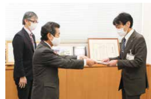
12月16日、市に対し申し入れを行った。

情報通信技術（ICT）の利活用による、市民の多様な意見の把握、市民への情報提供、議会運営の効率化、自然災害や感染症等に対する危機管理への対応など、議会機能の強化が求められる。議会におけるICTの利活用に向けた市当局との協議の場の設置及び「遠野市議会ICT推進基本計画」策定への参画を求め、市当局に申し入れするもの。