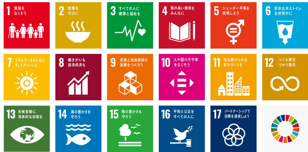
SDGs（エスディーゼズ）とは、「Sustainable Development Goals（持続可能な開発目標）」の略称。2015年の国連で決められた国際社会共通の目標。2030年までに達成すべき17の目標が挙げられている。