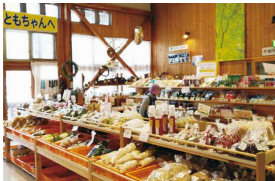
地元産マツタケを待ち望む産直ともちゃん

答 (市長) ..... 出荷解除に向け引き続き検査等を実施していく。また、出荷基準の緩和に向け声を出していく必要があるのではないかと考えている。