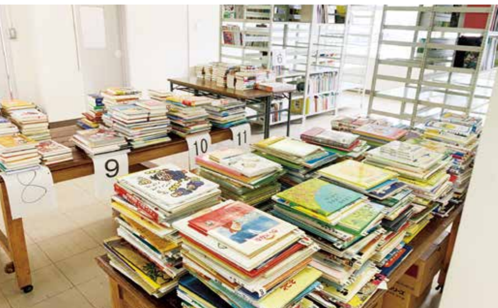
市役所東館庁舎には全国から寄付された本が続々と届けられている

指定管理者制度等への移行は、市内一斉に足並みを揃え行われることが望まれるが。 答 市内全11地区、同