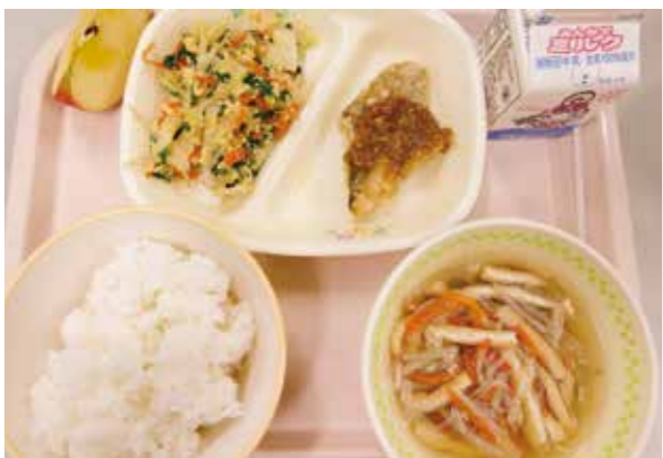
遠野産食材を約7割使用。栄養バランスが整った温かい給食。