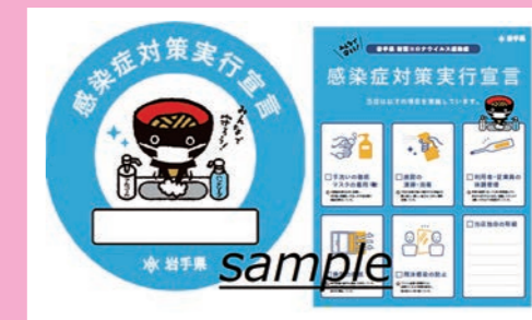
「感染症対策実行宣言」ステッカーとポスター

県は、県民が店舗を安心して利用し、消費活動ができる取り組みを支援するため、「感染症対策実行宣言」ステッカーと取組状況を表示するポスターを作成。ガイドラインに沿った感染症対策をしている店舗は、パソコンからダウンロードして利用することができます。 岩手 感染症対策実行宣言 検索