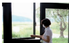
窓を開けて換気する職員