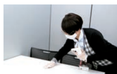
テーブルを消毒する職員

手すりやドアノブなどの人が触れる場所をはじめ、テーブルや椅子などの備品も消毒しています。また、定期的な換気に努めています。