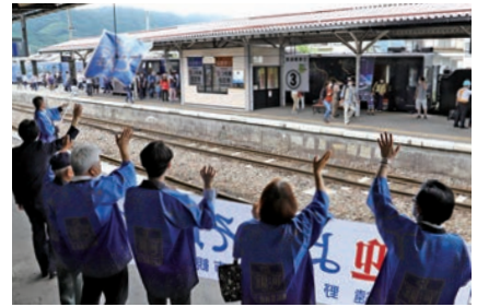
SL銀河を降り立った乗客を横断幕でお出迎え

新型コロナウイルスの影響で運休していたJR東日本によるSL銀河の定期運行が釜石線の花巻―釜石間で再開。SLが停車する宮守駅と遠野駅では郷土芸能団体が乗客を歓迎しました。SLは、車内消毒やマスク着用など感染対策を実施して運行。今月16日までの10回、黒煙をなびかせ運行する予定です。