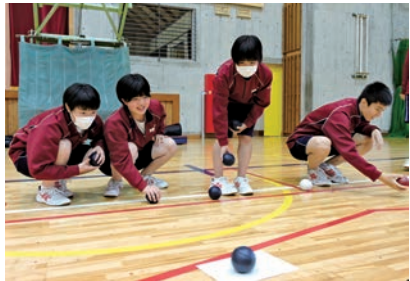
パラスポーツ・ポッチャを体験する遠野中生徒

パラリンピック競技大会の正式種目・ポッチャの体験会は遠野中で開かれ、3年生115人と花巻清風支援学校遠野分教室中学部の7人が参加。当日は、テレビ岩手からのポッチャセット寄付採納式が開かれたほか、順天堂大学とのリモート講義が行われ、共生社会の考え方やパラスポーツへの理解を深めました。