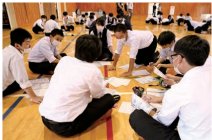
どの候補者に投票したら良いか話し合う生徒

遠野高校で、謎解きゲームを取り入れた主権者教育「参政剣伝説」が県内初開催されました。同教育は、高校生が主権者として政治への参加や投票することの大切さを理解するためのもの。参加した1年生92人は、ゲームや模擬投票体験をした後に選挙制度についての講話を聞き、政治や選挙に親しみました。