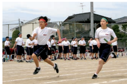
全生徒でバトンをつなぐ全員リレー

大運動会は同校で行われ、遠野中学校と花巻清風支援学校遠野分教室中学部の生徒計362人が熱戦を繰り広げました。新型コロナウイルス対策のため保護者の観覧を規制して開催された中、生徒らは競技や応援を通して絆を深めました。運動会や体育祭は市内各地の小中学校で開かれ、元気な声があふりました。