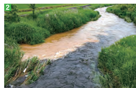
1・2_小友町外山地区で開発中の太陽光発電（メガソーラー）事業地から流出する濁水 3・4_山林が切り開かれ、設置される外山地区の太陽光パネル ※1～3の写真は、昨年6月撮影