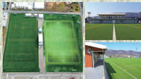
左/新たに整備されたB面(左側) 右上・右下/クラブハウスと一体的に利用することができます