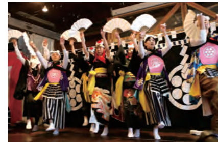
「木曾舞」を披露する飯豊神楽

町家で楽しむ女子神楽(遠野文化研究センター・同実行委員会主催)は、一日市商店街の旧三田屋で開催され、のべ160人程が来場しました。似田貝・小倉・平倉・鱒沢・飯豊の神楽5団体から女性13人が出演。「御神楽」や「翁舞」のほか神話や物語をモチーフにした多彩な舞を披露し、観客を魅了しました。