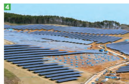
1・2_小友町外山地区で開発中の太陽光発電（メガソーラー）事業地から流出する濁水 3・4_山林が切り開かれ、設置される外山地区の太陽光パネル ※1～3の写真は、昨年6月撮影