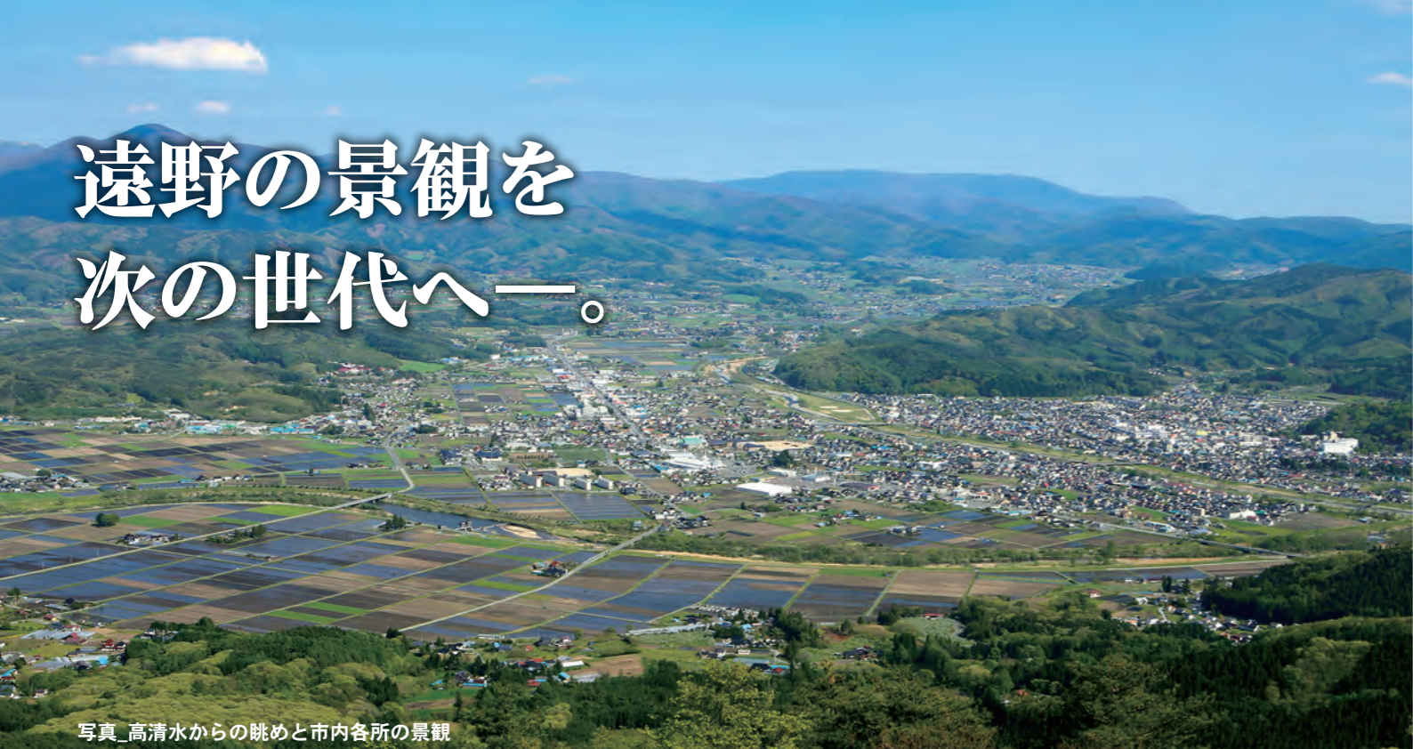
写真_高清水からの眺めと市内各所の景観