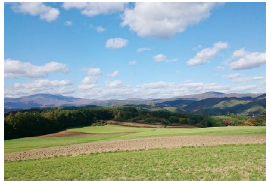
美しい景観を守りたい

基準を設けることは可能であるが、守られなかった場合の罰則規定や基準通りに実施されているかの監視等、今後の検討課題である。