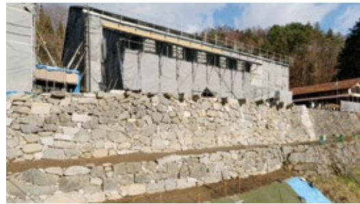
現在整備中の千葉家

他自治体一体となって新しい過疎法設立に向け、要望活動を行っている。今後も有利な財源を確保して事業を進める。