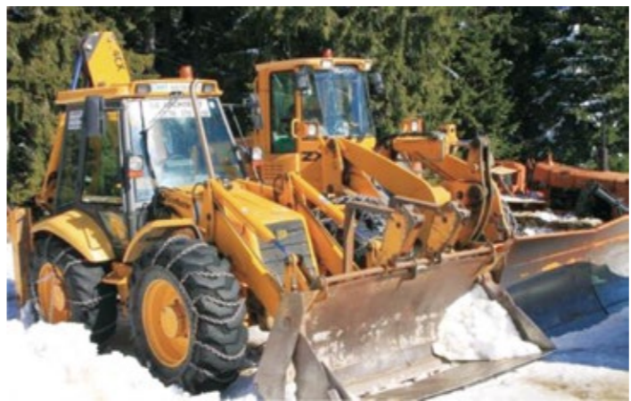
この冬は降雪が少なく、出動回数も大幅に減った除雪機械

当市に合ったより良い除排雪業務のあり方や、保証ではなく傷んだ道路を補修するような修繕費として、費用を支払う手法も検討していきたい。