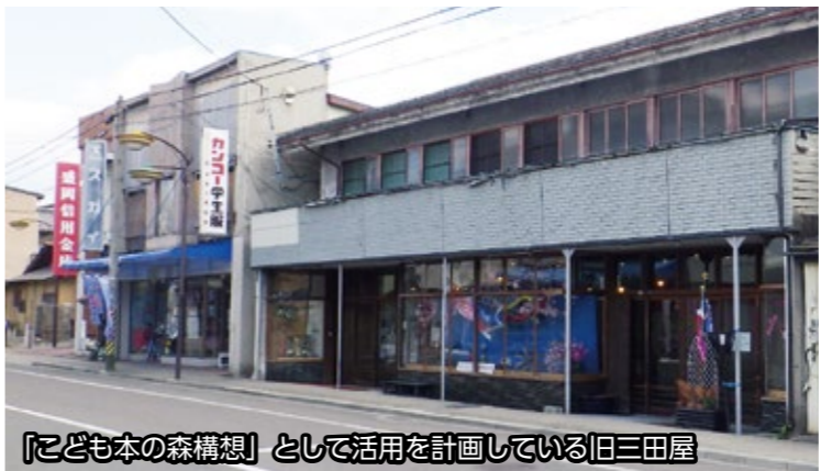
「子ども本の森構想」として活用を計画している旧三田屋

答(市長)：設置場所は、利便性向上と経費節減、施設運営の効率化という観点から、「子どもの城」