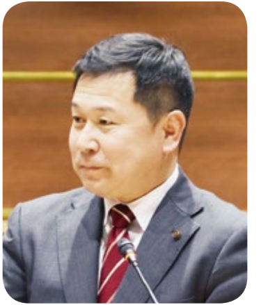
菊池 美也 議員