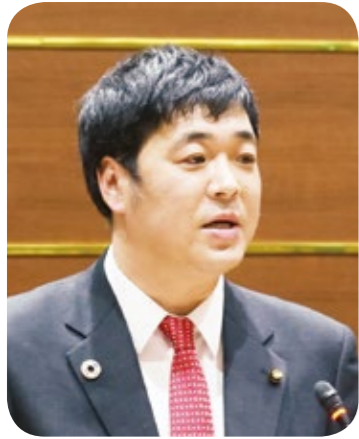
小松 正真 議員