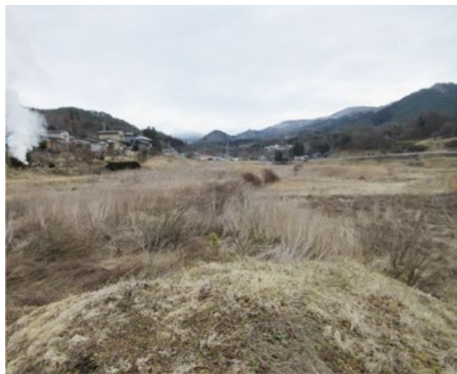
増加し続ける耕作放棄地