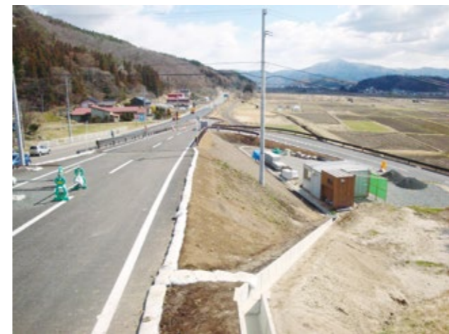
風の丘進入路整備により市道が切り替えとなった

事業用地に係る地権者や周辺住民、風の丘関係者等を中心に説明したが、今回の道路整備については、もう少し範囲を広げて説明す