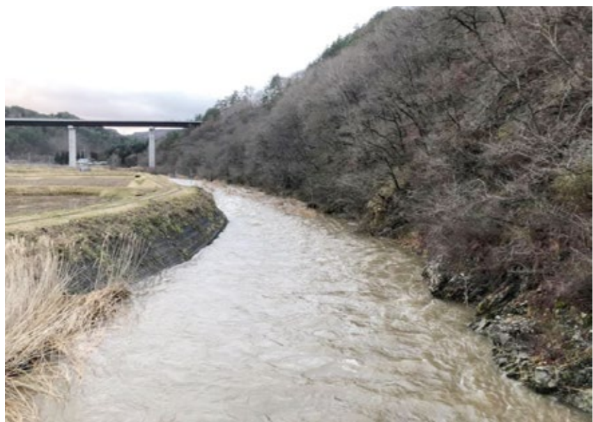
3月定例会閉会中3月11日にも小友川の汚濁を確認