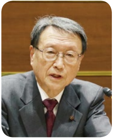
佐々木 大三郎 議員