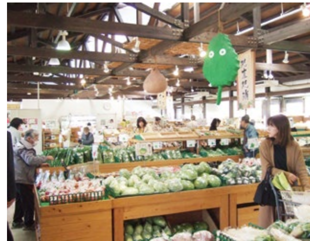
あぐりん村農産物直売所

◆「あぐりん村」 長久手市では、耕作放棄地を田園バレー構想に活かし、農業に通じたまちづくりに取り