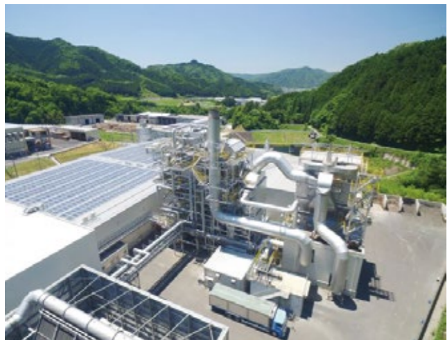
岡山県真庭市出資によるバイオマス発電所

新たな高校再編後期計画は案の段階、前期計画を引きずった計画になっている。県下市町村長懇談会での提言により連携取り組み、2校の魅力年全国に発信し、県外入学者の拡大を図り、将来の定住人口に繋げていきたい。