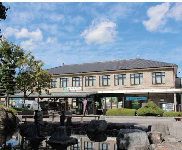
解体跡地に同規模新築が計画されている JR 遠野駅舎

答(市長) …………… 10月検討結果報告を受け、改めてJR盛岡支社の運輸部と企画部に對し、 ①計画年数短縮 ②コストダウン ③運営方法を含めた事業可能性 の3点について再度検討を申し入れており、令和2年6月頃には結果が明らかとなる見込みだ。