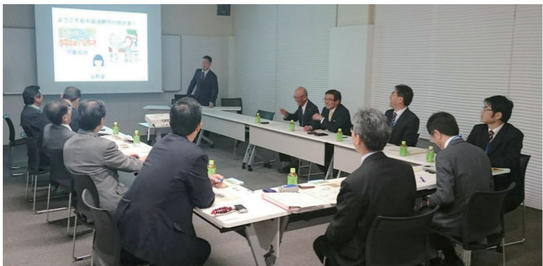
教育民生常任委員会は、上土幌町を視察しました。(P5 参照)