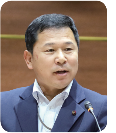
菊池 美也 議員