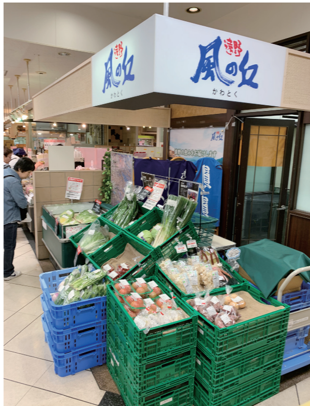
盛岡市中心部の百貨店にある店舗

風の丘20周年記念事業は1600万円という巨額を投じた事業だったが利益が300万円ほどしか上がっていない。売上増加650