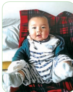
浩さんのお子さん