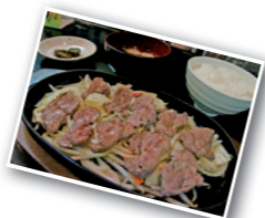
↑こだわりのラム肉を使った鉄板焼き

昔から愛されている店の味を守りながら、新メニューにも挑戦したい。常連さんから観光客まで、たくさんの方が遠野のジンギスカンを楽しめる店にしたいです。