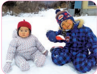
史朗さんのお子さん