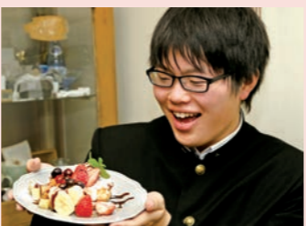
インスタ映え間違いなし!

おすすめのパンケーキを試食。生クリームと果物がきれいに盛り付けられていて、食欲をそそります。ふわふわでほんのり甘く、ベリーの酸味がアクセントになっていて甘いものが苦手な人にもおすすめ!