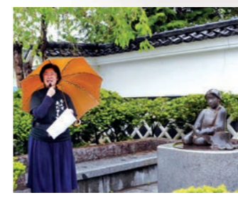
彫刻「こだま91」を解説する筆者

遠野文化研究センターの活動に興味を持っていただけるような情報を、6月からお届けしています。今月は駅前通りの気になる彫刻たちです。