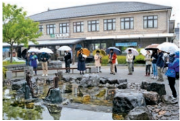
駅前のカッパ像を見学する参加者

このような地道な講座は、普段の遠野が違って見える小さな「種」をまくようなもので、すぐに観光客が増えるなどの結果につながる訳ではありません。しかしこれをきっかけに、住民の皆さまが遠野に住むことを楽しみ、好きになって、その想いを市内外の人に伝えてもらえたらと願っています。駅前通りの彫刻をはじめ遠野にとって当たり前なのが、地域の新たな宝になるのではないかと考えています。