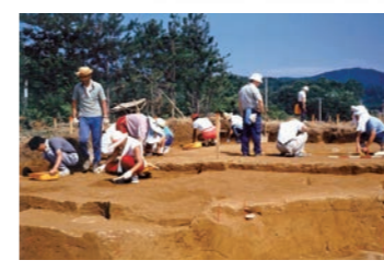
昭和60～61年に行われた発掘調査の様子

人類は約700万年前にアフリカで誕生した。彼らは何百万年もかかってそこから出て世界中に広がっていった。そうして日本列島に到達した。その彼らはま