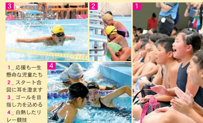
1_応援も一生懸命な児童たち 2_スタート合図に耳を澄ます 3_ゴールを目指し力を入れる 4_白熱したリレー競技

各種表彰 ※敬称略 ◆第13回市内小学校水泳記録会(7月31日、市民プール) ※優勝者のみ ■男子 ▽共通100メートル平泳ぎ 佐々木翔星(青笹6) 1分31秒49(大会新) ▽共通100メートル自由形 板倉颯汰(宮守6) 1分28秒10 ▽5年25メートルバタフライ 及川汰篤(小友、高橋伯(綾織)24秒64 ▽6年25メートルバタフライ 石原文杜(宮守) 19秒34(大会新) ▽4年以下25メートル背泳ぎ 川久保智尋(土淵) 24秒33 ▽5年50メートル背泳ぎ 小原千慧(遠野北) 56秒34 ▽6年50メートル背泳ぎ 鈴木心大(青笹) 43秒12 ▽4年以下25メートル平泳ぎ 多田航輔(鱒沢) 30秒48(大会新) ▽共通100メートル個人メドレー 佐々木翔星(青笹6) 1分30秒71 ▽5年50メートル平泳ぎ 千葉蒼太(宮守) 1分01秒40 ▽6年50メートル平泳ぎ 佐々木翔星(青笹) 43秒87(大会新) ▽共通50メートルバタフライ 石原文杜(宮守6) 46秒08 ▽5年50メートル自由形 小笠原瑞起(遠野北) 43秒46 ▽6年50メートル自由形 田代謙真(遠野) 38秒40 ▽4年以下25メートル自由形 佐々木悠希(土淵) 19秒47(大会新) ▽共通4×25メートルメドレーリレー 青笹(鈴木心大・佐々木翔星・奥寺健太・菊池八雲) 1分21秒04(大会新) ▽共通4×50メートルリレー 遠野(田代謙真・菊池大晴・榊原康生・高橋快大) 2分39秒85(大会新) ■女子 ▽共通100メートル平泳ぎ 佐々木舞子(青笹6) 1分51秒28 ▽共通100メートル自由形 小森暖菜(遠野北6) 1分36秒36 ▽5年25メートルバタフライ 菊池琉依(上郷) 24秒66 ▽6年25メートルバタフライ 阿部愛奈(土淵)・立花陽菜(同) 20秒95 ▽4年以下25メートル背泳ぎ