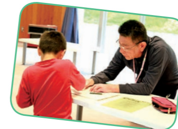
↑同教室は、地域住民が子どもたちの学習を支援。支援するスタッフも随時募集しています!

市は、児童の放課後の安心安全な居場所づくりと家庭学習の習慣化を目的に「放課後子ども教室」を開催しています。同教室は、学校や各地区センターなどを会場に、学校・家庭・地域の協力のもと実施。開催日程は学校を通してお知らせしています。詳しくは問い合わせください。