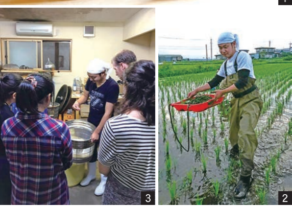
1_民宿とおのが開発した、どぶろく・どぶきゅー。このどぶろくを楽しみに民宿を訪れる人も多い 2_今年は雑草の量が多く、連日田んぼの草取りを行っている 3_蔵見学を訪れた学生などに、米やどぶろくについて説明することもある