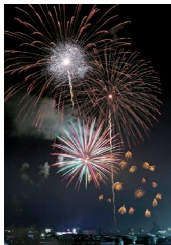
心配された雨も上がり、花火が夜空を鮮やかに彩りました

夏の風物詩「遠野納涼花火まつり」が早瀬川緑地公園グラウンドで行われ、市民や帰省客が光と音のショーを楽しみました。今年は、約500もの企業・団体・個人から多くの協賛を得て開催。スターメインなどの色鮮やかな花火が次々に打ち上げられると、会場には拍手や歓声が広がっていました。