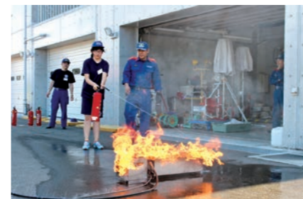
消火器の取り扱い方も勉強しました

さまざまな訓練を通じて防災について学ぶ同スクールは、市総合防災センターで開催。市内8小学校から参加した4~6年生の児童25人は、楽しみながら万が一の際の対応を学びました。参加した児童らは、煙の充満した部屋からの避難方法や放水訓練などの実技に挑戦。防災についての理解を深めました。