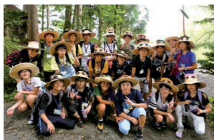
カッパ淵でカッパ釣りに挑戦した大府市小学生

友好都市・愛知県大府市から小学生20人が遠野を訪れ、4日間の日程で夏の遠野を満喫しました。遠野小学校を訪れた児童らは、同校6年生とゲームや給食と一緒に楽しみ交流。また、東日本大震災での取り組みを学習したほか、カッパ釣りやわら馬づくり体験、ジソグスカンなど遠野の魅力を味わいました。