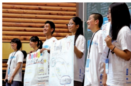
学生が寸劇を交えてアイデアを発表

新しい未来づくりの手法を学ぶサマープログラムは、遠野みらい創りカレッジで行われました。同プログラムには、市内外の大学生と高校生31人が参加。6次産業化・遊休資源活用・共生社会をテーマに学生らが考えた遠野の明るい未来を発表しました。参加者は新たな発想の実現を期待し、胸を弾ませました。