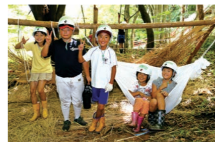
基地にはブランコやハンモックも設置!

綾織児童館は、千葉家文化に親しんでもらおうと同所の裏山で秘密基地づくりを行いました。基地づくりには、1~6年生まで25人が参加。カヤや木材など千葉家を建てる時に使われた材料と道具で基地づくりに挑戦しました。子どもたちは道具の使い方を教わりながら、思い思いの基地を完成させました。