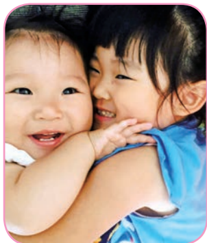
阿部家のお子さん