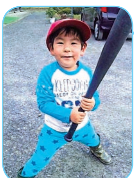
高橋家のお子さん