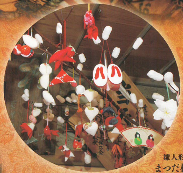
雛人形所蔵 まつた松林堂