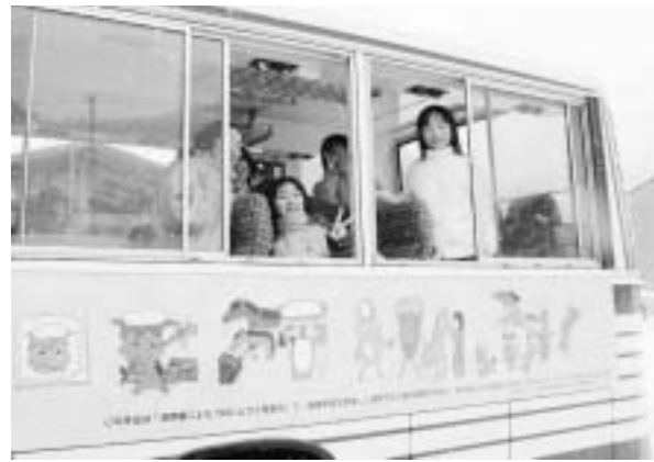
民話のキャラクターが描かれたバスに乗車し笑顔を見せる児童たち