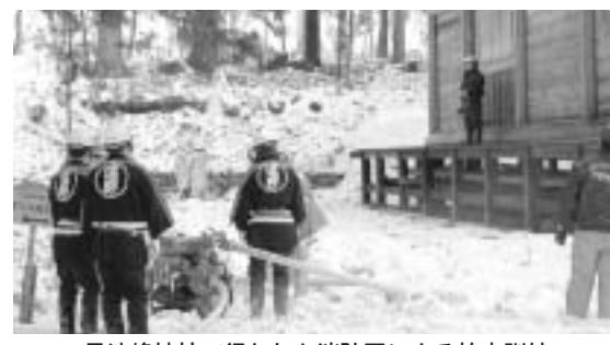
早池峰神社で行われた消防団による放水訓練

「文化財防火デー」をご存じですか？国宝の法隆寺金堂壁画が昭和二十四年一月二十六日に焼損するという痛ましい事故が発生しました。こうした惨劇を繰り返さないために一月二十六日を「文化財防火デー」と定め、毎年この日を中心に全国で文化財防火運動が展開されています。市では、一月二十九日に附馬牛町大出の早池峰神社と宮守町下宮守の塚沢神社の二カ所で、文化財防火訓練を実施しました。早池峰神社には県指定天然記