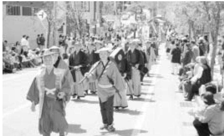
事業を活用して遠野町地域づくり連絡協議会が実施した南部氏遠野入部行列

市は、地域の特性を生かし創意と工夫を凝らした特色ある地域づくりを推進するため「地域づくり推進事業」を実施いたします。平成十七年度は、市内の二十七団体が、特色ある四十三事業（総事業費約一千万円）を実施。この事業は、町単位で組織する団体や新たに組織する団体も対象となります。魅力ある地域づくりのため、この事業を活用してみませんか。