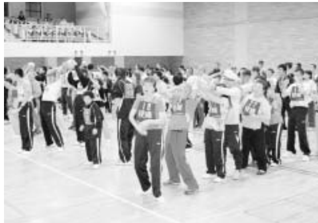
昨年8月26日に3障害合同で行われたふれあいスポーツ大会

障害者自立支援法は、障害のある人が自立した生活を送れるよう、地域で安心して暮らせる共生社会を目指した新しい障害者福祉制度です。これまでの制度は障害の種類（身体・知的・精神）によって制度格差があり、複雑な事業体系となっていました。四月からは、障害の種類ごだった手続きや利用者負担の仕組みが統一され、共通したサービスを受けられるようになります。今回は、新しい制度の概要をお知らせします。