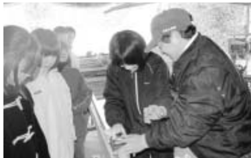
講師の手ほどきを受け、かなながらひきをする生徒

初めのうちは慣れない手つきでしたが、講師のアドバイスを受けて作業を進めると次第にコツをつかみ、最後には立派なかなながらを完成させていました。