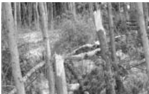
大雪により幹が折れてしまったアカマツ