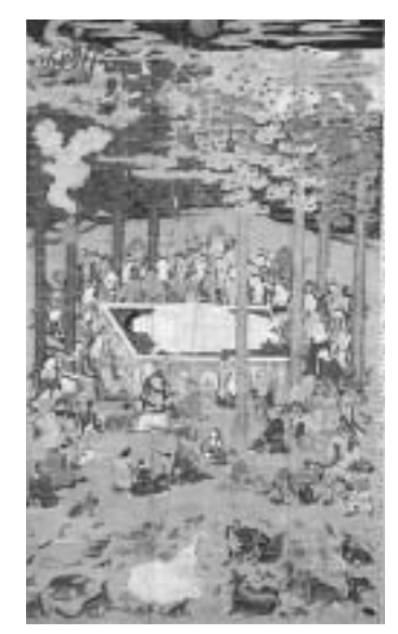
県指定有形文化財 所在地 小友町 所有者 常楽寺

念物の「夫婦イチイ」、市指定有形文化財の「神門」「本殿・拝殿」「中門」「太刀」などがあります。塚沢神社には元禄四年（一六九一年）に建立されて弘化三年（一八四六年）に再建された「地藏堂（本殿）」と、その中に「本尊」「天井絵」「額類」などがあり、どちらも地元の人たちが守り続けてきた貴重な文化財です。早池峰神社では午前七時三十分北側山林から火災が発生したという想定で、地元消防団や婦人消防協力隊など約六十人が参加し、放水訓練や消火器を使った初期消火訓練などを行いました。塚沢神社では午前九時から地元消防団や婦人消防協力隊など約三十人が参加し、重要品の持ち出し訓練やホース延長訓練などを行いました。どちらの神社も初めての本格的な防火訓練でしたので、万が一の火災から文化財を守る体制を確認することができました。市内には、このほかにも多くの文化財があります。わたしたちの貴重な財産である文化財を、みんなで火災から守りましょう。