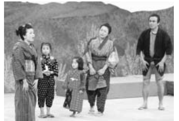
商人に売られていく娘を見送る西蔵(右)とその家族