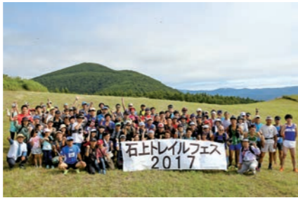
青空のもと、石上山の自然を満喫しました

綾織スポーツクラブは、国民の祝日「山の日」に合わせ、綾織町の石上山麓で登山やトレイルランを楽しむイベントを開きました。今回で2回目となる同フェスには、県内外から91人が参加。参加者はランとウォークの部に分けられ、石上山の特設コースで競走。雄大な景色を満喫し、心地よい汗を流しました。