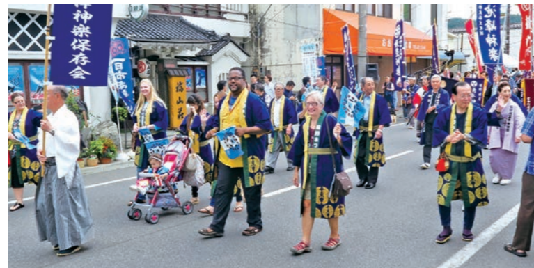
昨年遠野まつりに参加した友好訪問団。今年も参加予定!