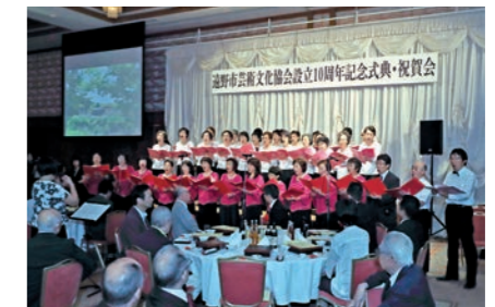
映像に合わせて美しい歌声を響かせる合唱団

市内55の芸術文化団体が構成する同協会の設立10周年を祝う式典は、あえりあ遠野で行われました。式典では、協会の活動に尽力した16人に感謝状が贈られ、これまでの歩