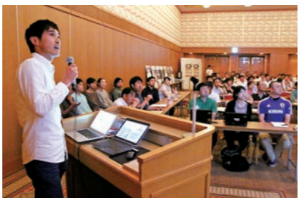
活動の経過と実績を報告しました

都市部から遠野に移住し、地域資源を生かした事業の起業を目指す「遠野ローカルベンチャー事業」の活動報告会は、あえりあ遠野で開催されました。同事業に取り組んでいる