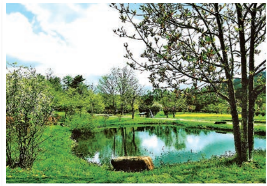
平成28年度最優秀作品『遠野に行ってきました』 撮影者／菅道和紀さん(青森県)