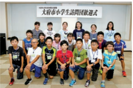
歓迎式ではカップ捕獲許可証も交付されました

友好都市・愛知県大府市から小学生20人が遠野を訪れ、4日間の日程で夏の遠野を満喫しました。児童は、魚のつかみ取りや草木染などに挑戦したほか、ジンギスカンなど遠野の味も堪能。また、後方支援資料館で震災での取り組みを学習したほか、最終日は遠野小学校を訪れ、同校の児童と交流を深めました。