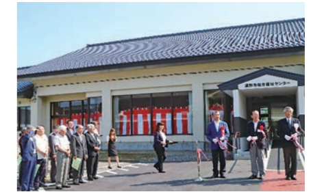
新たに設けられた連絡通路前でテープカット

松崎町にある市総合福祉センターの改修工事が完了し、現地で報告会が行われました。報告会には、関係者ら20人が出席。テープカットや施設見学が行われ、工事完了を祝