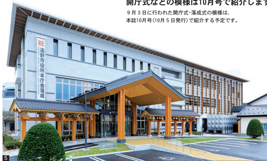
5_南西から見た本庁舎 6_建設工 事の完成引渡式。庁舎建設を担った 松田建設・栄組特定共同企業体から 本田市長にカギが手渡されました 7_庁内スタンプラリーも開催し多く の市民が本庁舎の内部を探索