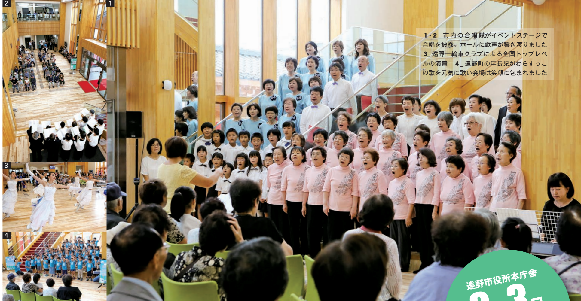
1・2_市内の合唱隊がイベントステージで 合唱を披露。ホールに歌声が響き渡りました 3_遠野一輪車クラブによる全国トップレベ ルの演舞 4_遠野町の年長児がわらすっこ の歌を元気に歌い会場は笑顔に包まれました

9月3日に行われた開庁式・落成式の模様は、 本誌10月号(10月5日発行)で紹介する予定です。