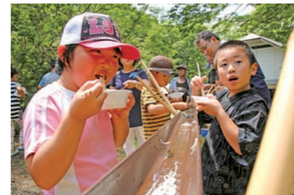
名水を使った流しそめんは大盛況

達磨部地域づくり連絡協議会が企画したイベントには、親子連れなど350人が来場。ステージでは、行山流湧水鹿踊りなどが披露されたほか、そば食い大会やスイカ割り大会などが行われ、会場は盛り上がり