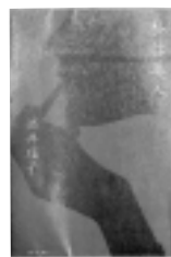
「私は美人」 酒井順子 著

美人とは一体何なのか?美人を目指すにはいられない女性の行動と本音を徹底的に分析。著者の鋭い観察眼に思わずうざを打ってしまおう一冊です。