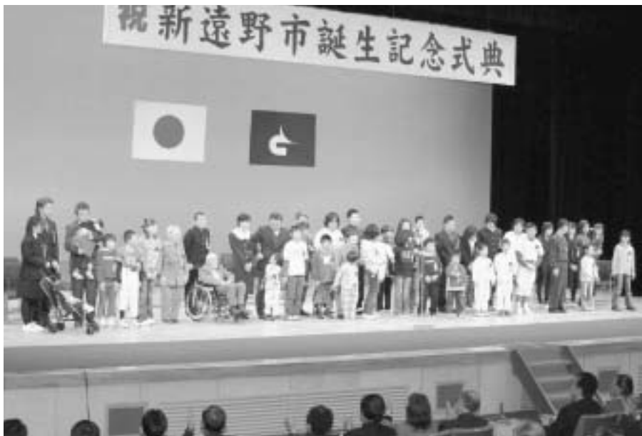
6組の元気家族が集まり新「遠野市」の誕生を祝った記念式典

新「遠野市」の誕生記念式典は平成17年12月23日、市民センター大ホールで市民や来賓ら約800人が出席して行われました。新市の将来像である「永遠の日本のふるさと」の実現に向け、心をひとつにして新市の限らない発展を誓いました。