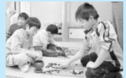
盤上で熱戦を展開する参加者

平成18年新春ふれあい将棋・囲碁大会(市青少年を育てる市民会議など主催)は1月11日、市勤労青少年ホームで行なわれ、29人が5部門に分かれ優勝を目指して自慢の腕を競いました。