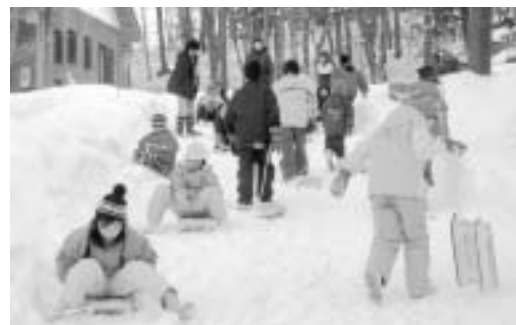
手作りのそりで坂を滑る児童たち

午前中は木材を組み立て、全長約45センチの木製そりを作成。午後は場所を移し、そり滑りを行いました。既製品とは勝手が違う滑りに、初めは悪戦苦闘。次第にコツをつかむと、みんな時間がたつのを忘れ、何度も坂を駆け上がったのはそり滑りを楽しんでいました。