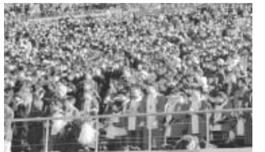
スタンドから必死に声援を送る市民ら