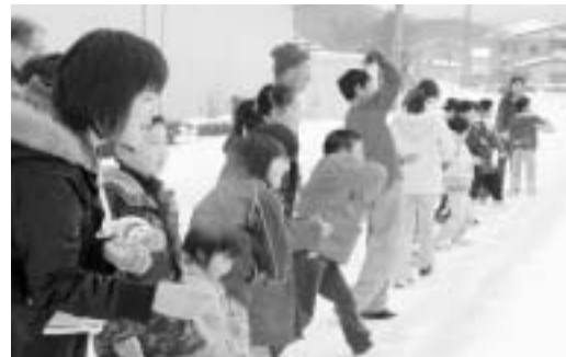
空にもちを投げ「カラスよばり」をする児童たち

参加者は全員でもちつきをしたり、みずき団子を飾った後は「カラス、カラス、もちっこけっからこーこ」と小さく切ったもちを空に投げてカラスを呼ぶ「カラスよばり」や、松の葉を稲の苗に見立てて雪の田んぼに植える「お田植え」などを行い、豊作を祈りました。