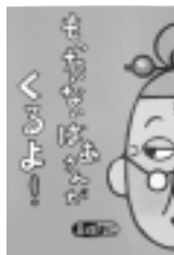
「もったいないばあさんがくるよ!」 真珠まりこ 著

野菜のへた、スイカの皮、鉛筆の芯...。普段は捨ててしまおう物でも、もったいないばあさんの手にかかればごみに出さずにフル活用。物を大切にする気持ちを学べる本です。