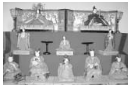
館林家(仲町)のひな飾り

また、子どもたちが川辺などにかまどを作り、食べ物を煮炊きするのが「かまつたき」です。ひな祭りは川で身を清め、飲食をして災いをはらう中国の風習が始まりであり、かまつたきも三月節句の行事の一つと見ることができるとはいいでしょう。