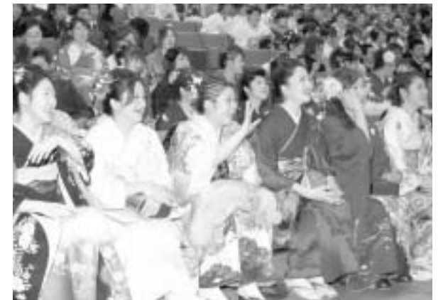
記念イベントに登場した中学時代の恩師に手を振る新成人