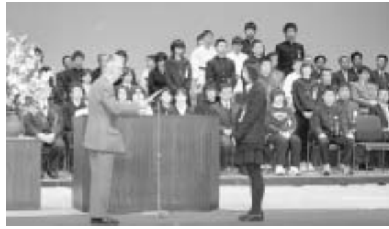
各分野で功績のあった個人、団体をたたえた顕彰式

第32回市民文化親交会は1月7日、約300人が参加して市民センター大ホールで行われました。市教育文化振興財団が主催したもので、教育や文化、スポーツなどで活躍し、功績のあった59人18団体を表彰。併せて市体育協会の表彰も行われ、スポーツ振興に功績のあった11人4団体を表彰しました。受賞者と功績の主な内容を紹介します（敬称略）。