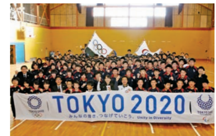
東京五輪開催に期待が高まります!

市は、同大会の魅力を伝えるためフラッグツアーを誘致。遠野東中学校を会場に、フラッグ受け渡しセレモニーなどが開催されたほか、アトランタ五輪女子バスケット