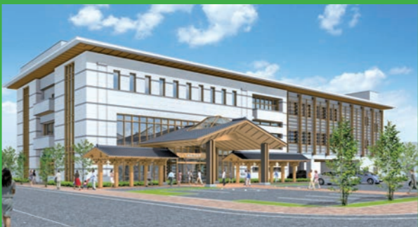
市役所本庁舎の完成イメージ