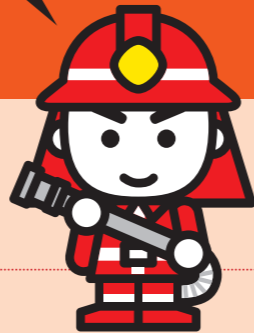
消防イメージキャラクター 消太くん

春先は空気が乾燥して火災が起こりやすい時期です。命を守るために、しっかり火災予防に取り組みましょう。