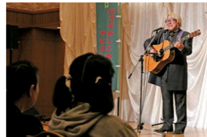
リビート山中さんライブに笑い声が響きました

市総合食育センター「ばすぼる」は、あえりあ遠野で食と健康に関するイベントを開催。食生活改善推進員らによる脳卒中予防劇や、神戸市出身のシンガーソングライター・