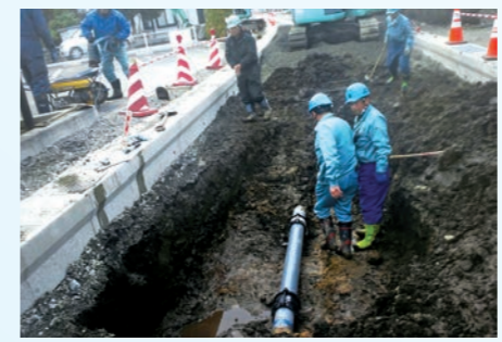
水道管の老朽化が進んでいます!