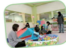
↑ミニすべり台や巨大積み木もあるよ!

わらすっこセンター(市役所西館)にあるわらすっこルームは、親子の触れ合いや子育て仲間との交流を深める場として開放されています。設置されている遊具や絵本は自由に使うことができます。屋内にある公園のような憩いの場として、ぜひ遊びに来てください。