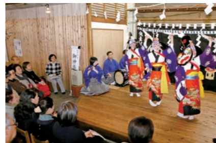
3月に高校を卒業したみなさんも出演

遠野文化研究センターと同実行委員会が主催した「町家で楽しむ女子神楽」が一日市商店街の旧三田屋で行われました。昔ながらの町家を舞台に、鱒沢・平倉・飯豊神楽の3