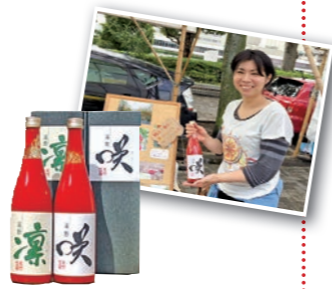
↑高品質のトマトジュース「咲」と「凜」は人気上昇中!

高品質のミニトマトを使ったトマトジュースを販売しています。遠野に根差した農業をしつつ、少しでもいいものをお客様に提供していきたいです。