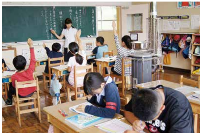
遠野の児童生徒の学力向上に期待

する機会を設けるほか、来年度より英検を活用した実用的な英語の向上に力をいれていく。