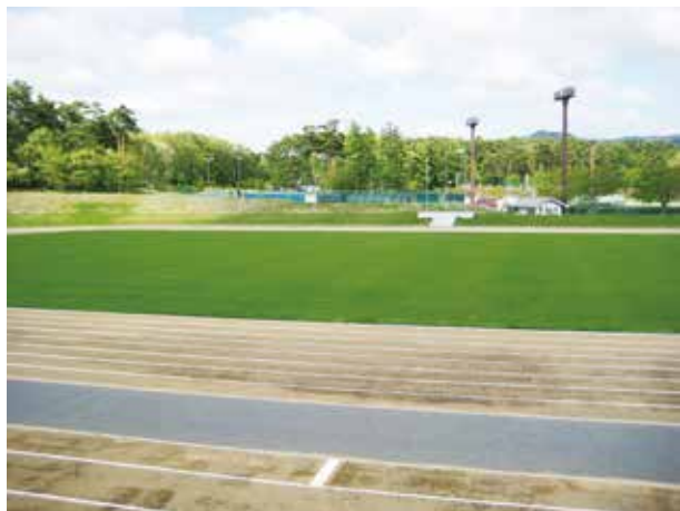
国体開催に合わせて芝生をグレードアップした陸上競技場

サッカー場の料金改定を含め、サッカー協会等、関係団体と協議した上での提案である。