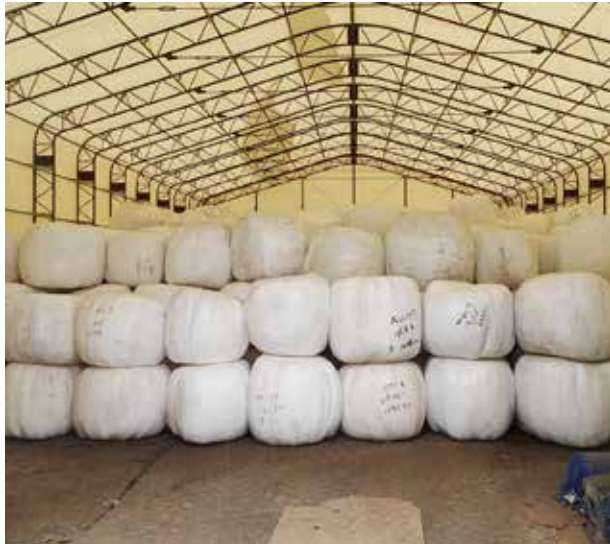
再ラップ化され集約保存されている汚染牧草 宮守町の西部集中保管施設

原木しいたけの新たな植菌本数は、汚染処理本数28万2千本に対して17万9千本の見込