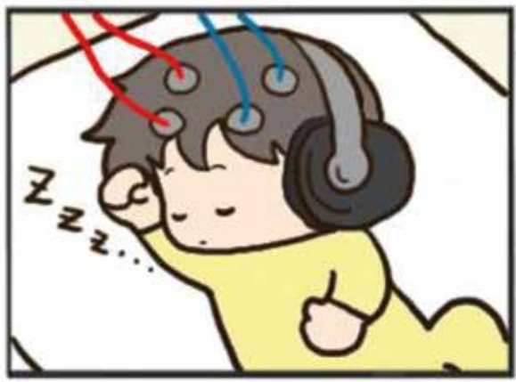
新生児聴覚スクリーニングは、数分程度で簡単に終わります。痛みはもちろん、赤ちゃんへの負担は一切ありません。