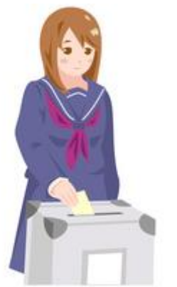
今秋、平成14年4月以来の市長選挙投票となるのか！

課題が山積する中で、初心に帰り、謙虚になり、改めて挑戦者の気概で市民の皆さんの負託を受けた。