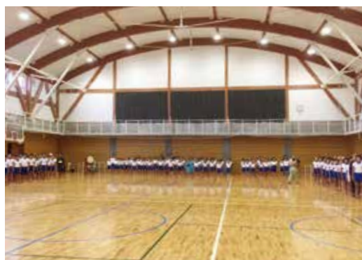
防災機能強化と合わせ、より安全安心で、ゆとりと潤いのある施設環境を。