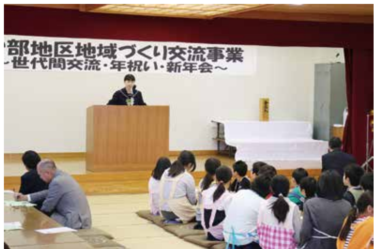
学校・保護者・地域・行政が一体となり育まれる遠野の子ども達の「生きる力」

実施、そこで学んだことを、日常の実践に取り入れ授業実践したり、お互いに授業力を見あつたりして授業力を高めている。