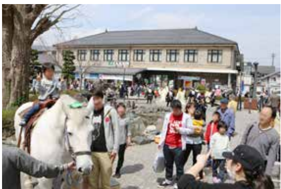
SL 銀河出発日の遠野駅前の様子