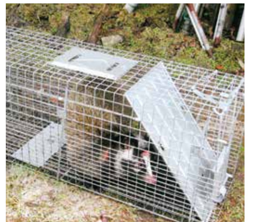
ワナで捕獲されたハクビシン