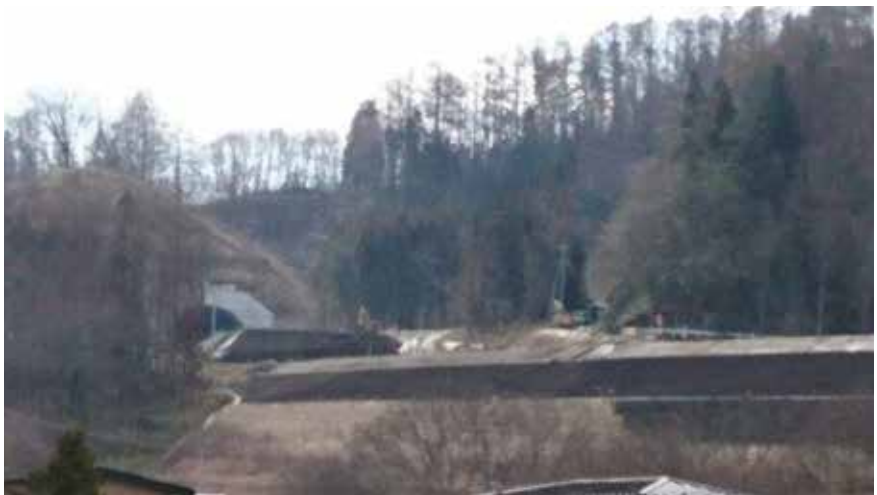
平成30年開通に向け工事が進む釜石自動車道（鍋倉トンネル付近）