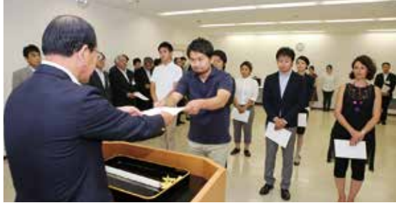
中長期的な目で地域活性化に向けた効果が注目される地域おこし協力隊