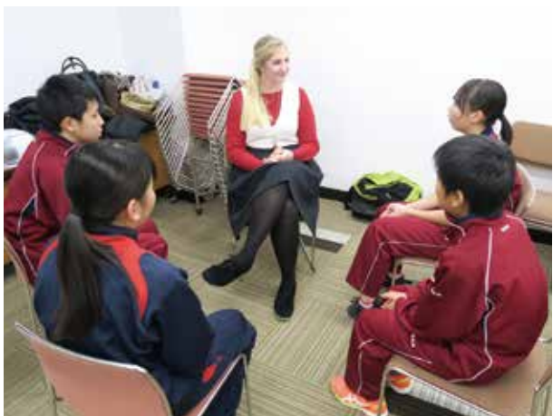
学習の質を高めて世界に羽ばたく人材を育てたい