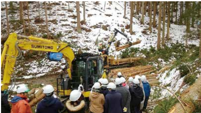
全国的に林業技術者の養成が求められている